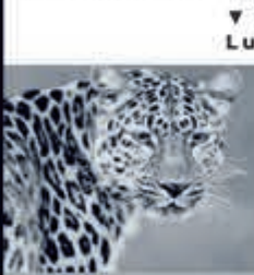
▼ Schilderij Luipaardenkop 163,-