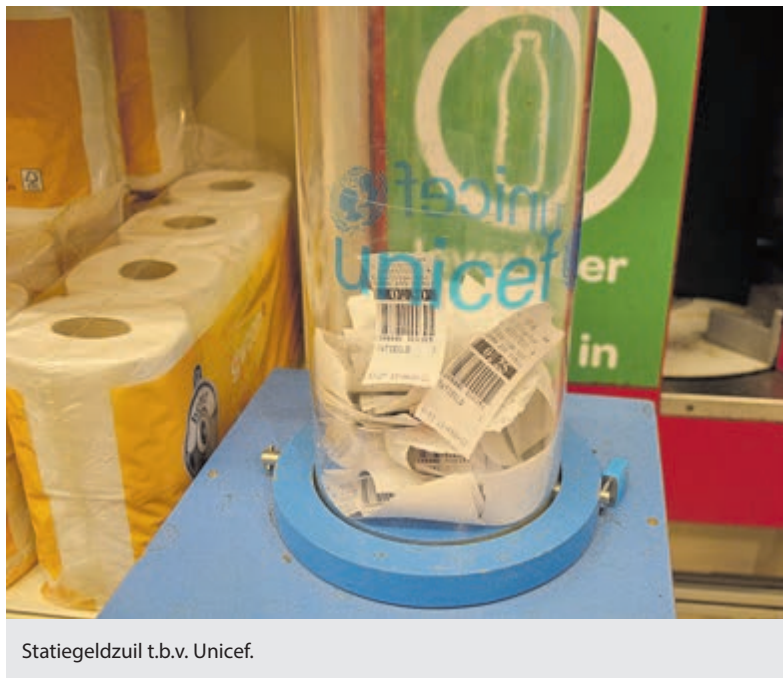
Statiegeldzuil t.b.v. Unicef.