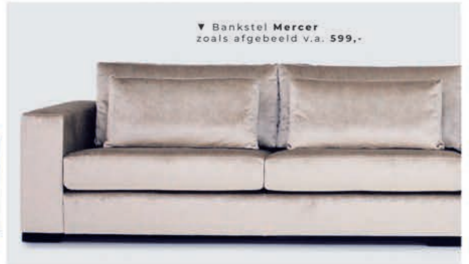
▼ Bankstel Mercer zoals afgebeeld v.a. 599,-