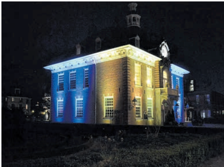
Raadhuis Heemstede in kleuren Oekraïne.

Heeft u vragen over het doneren van spullen of wilt u weten wat u allemaal kunt doneren stuurt u dan een e-mail naar: mailto:oekraïne@heemstede.nl .