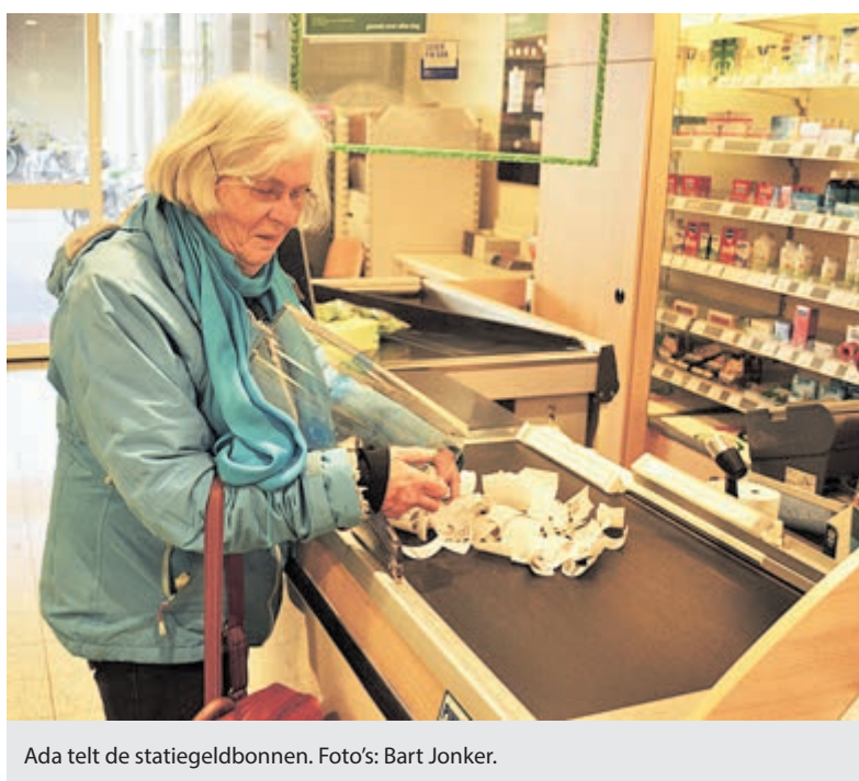
Ada telt de statiegeldbonnen.