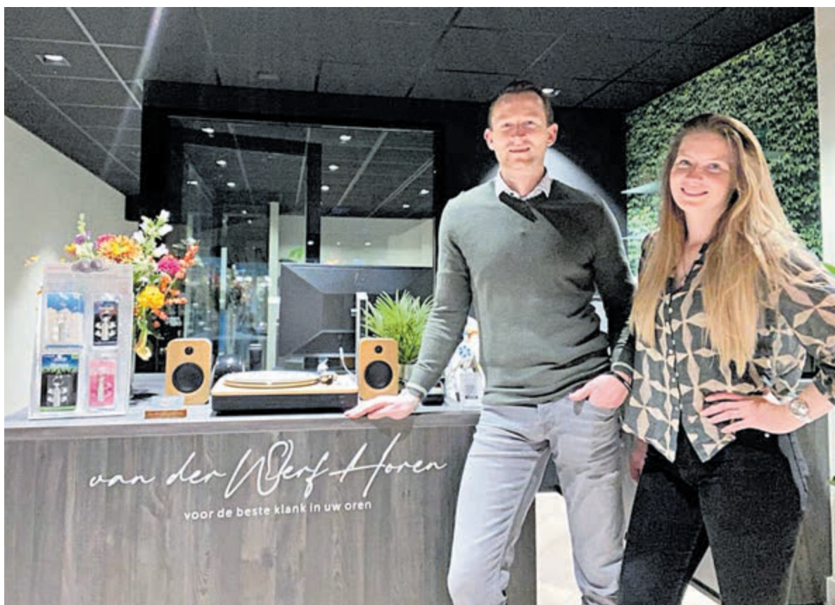
Het beste gehoorapparaat voor u bij Van Der Werf Horen.

Bekijk het assortiment op www.vanderwerfhoren.nl . Of neem contact op via 023-3034317.