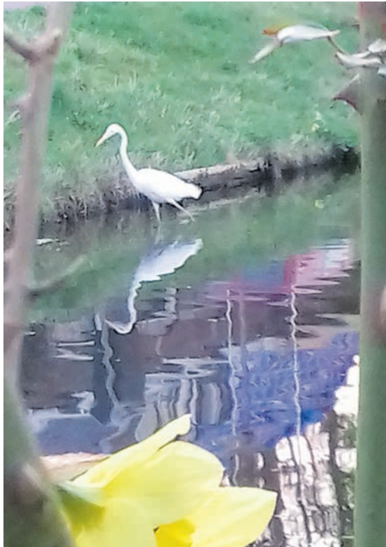
De zilverreiger aan de Kadijk.