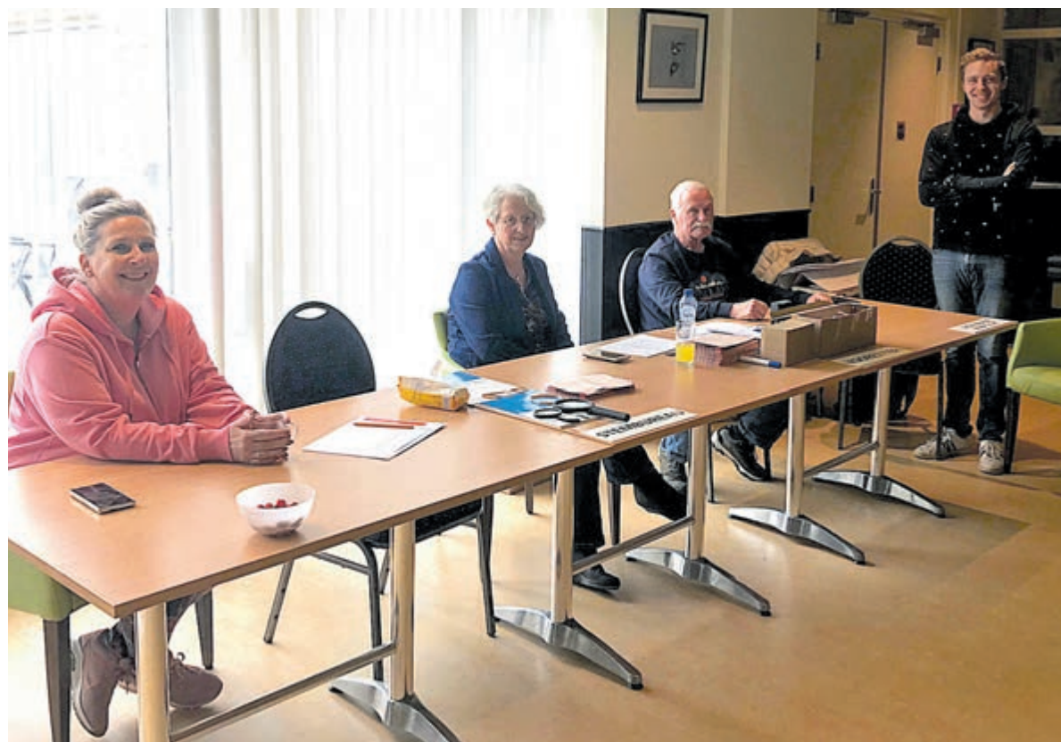
Stembureau Dorpshuis in Vogelenzang.