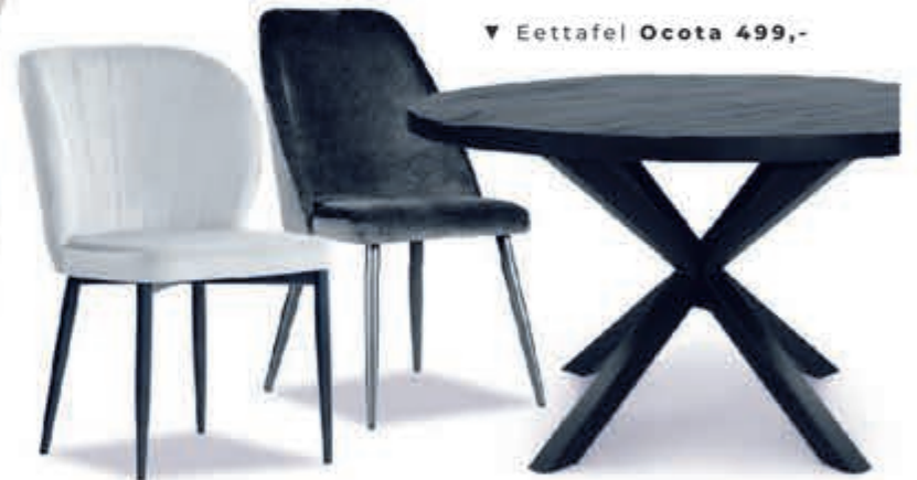
▼ Eettafel Ocota 499,-