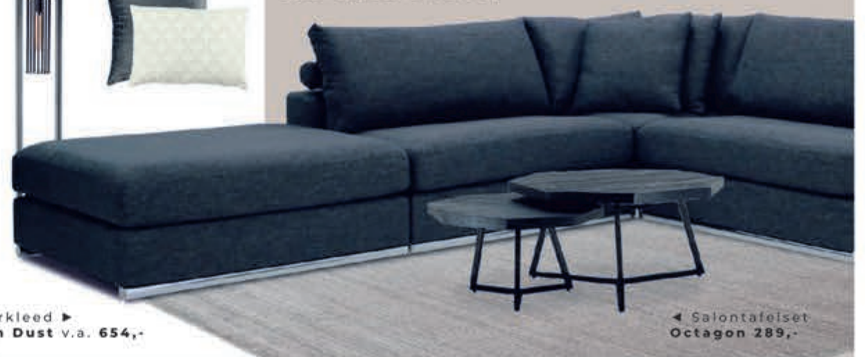
◀ Salontafelset Octagon 289,-