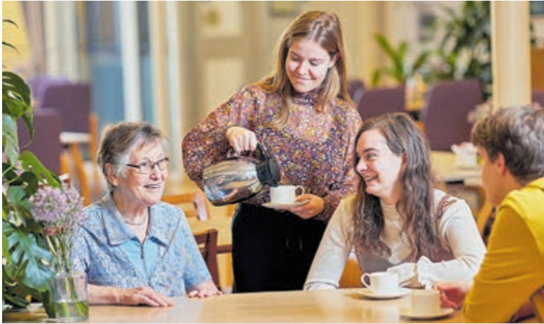
Bijzondere huisgenoten bij Sint Jacob.