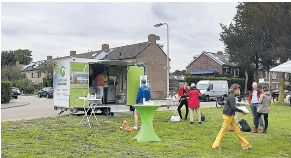
Demokar. Foto aangeleverd.

Meer informatie over de stichting: energiekeburger.nl en op Facebook.