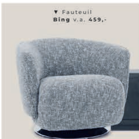
▼ Fauteuil Bing v.a. 459,-