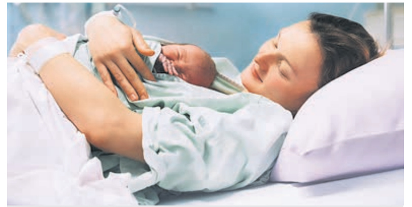
Een pasgeborene bij de moeder.

Kaarten zijn vooraf te reserveren via email: info@shantykoorVOC.nl of telefonisch via: Fred Boon 06 425 27 641.