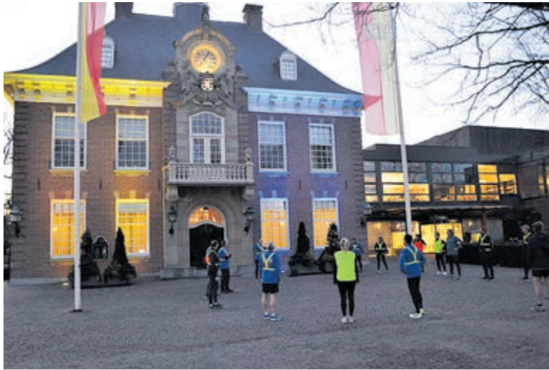
Warming-up met rek- en strekoefeningen voor het raadhuis.

Meer weten over de hardlooptrainingen of advies? Kijk voor alle informatie op: www.loperscompanyheemstede.nl . Bellen kan ook naar 06-20410066 of loop eens binnen bij Lopers Company by Enno op de Binnenweg 35 in Heemstede.