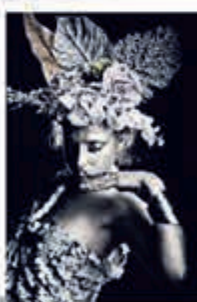
◀ Schilderij Vrouw 004 247,-