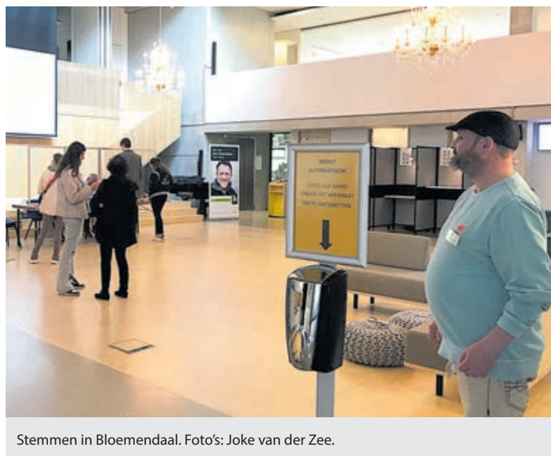
Stemmen in Bloemendaal.