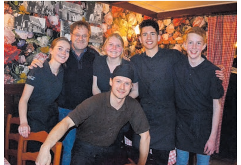
Het team van de Konijnenberg.