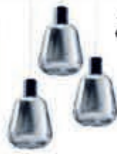
◀ Hanglamp Gary 299,-