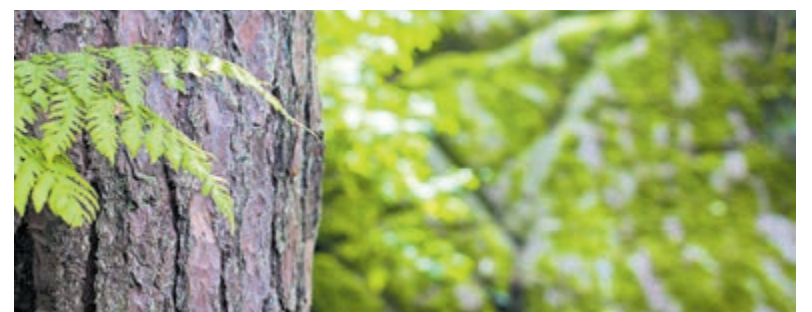
Monumentale bomen.