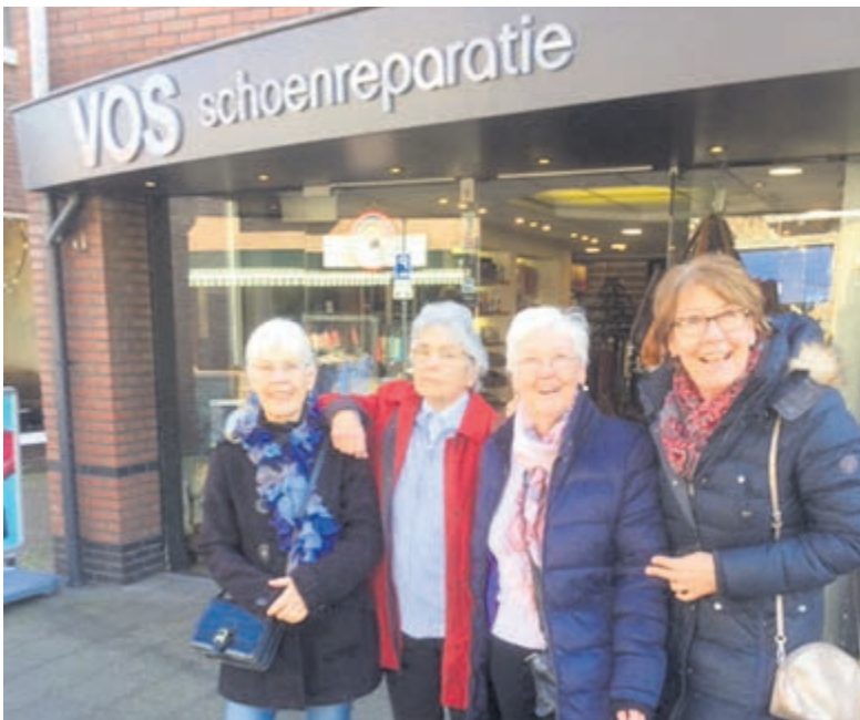
De delegatie van het NVVH-Vrouwennetwerk. Foto aangeleverd.

In zijn werkplaats staan verschillende machines, één dateert vanuit de oorlog, met Marshallhulp gekocht.