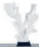
▼ Koraal Noah 93,-