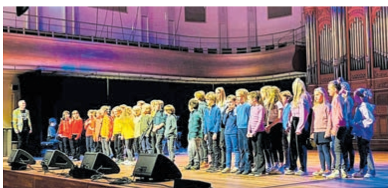
Groep 5 en 6 van de Bornwaterschool uit Bloemendaal tijdens korenbattle. Foto aangeleverd.

Een van de deelnemende scholen namens de gemeente Bloemendaal was de Bornwaterschool, die haar openbare karakter onderstreepte door in de kleuren van de regenboog het podium te betreden. Pabo studenten van Hogeschool InHolland begeleidden de kinderen muzikaal met een eigen band. Dieuwertje Blok nam de presentatie voor haar rekening.