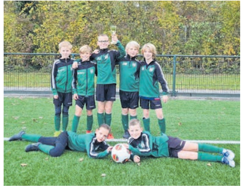
BSM-Jeugd gaat er zaterdag voor.