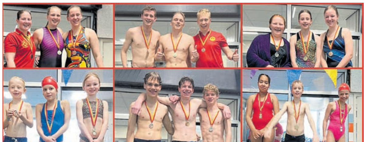
Zwemfeest bij de Heemsteedse Reddingsbrigade. Foto aangeleverd.

Om 19.30 is het feest weer afgelopen, volgende week is er weer 'gewoon' zwemmen.