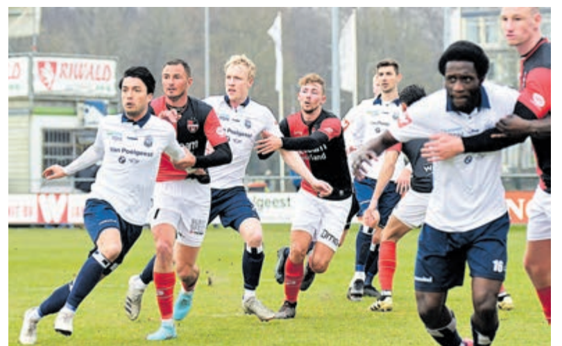
Kon. HFC tegen De Treffers.

Het uiteindelijke doel is om de spelers langer aan BSM te binden en het eerste elftal naar een stabiele derde klasse te laten doorgroeien. Hier gaan we met zijn allen voor!"