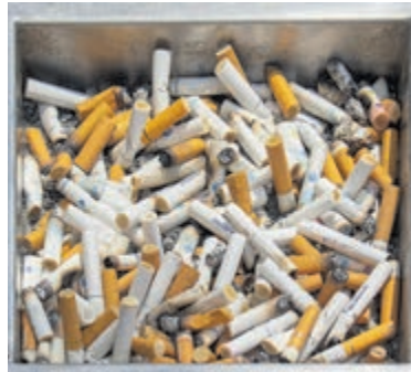
Sigarettenpeuken opruimen.

Wel aan de slag met zwerfafval, maar geen mogelijkheid gehad om mee te doen? Geen zorgen! Ontvang tijdens