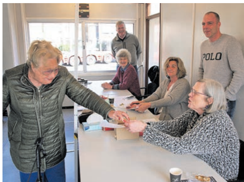
Stemmen op Station Heemstede/Aerdenhout.