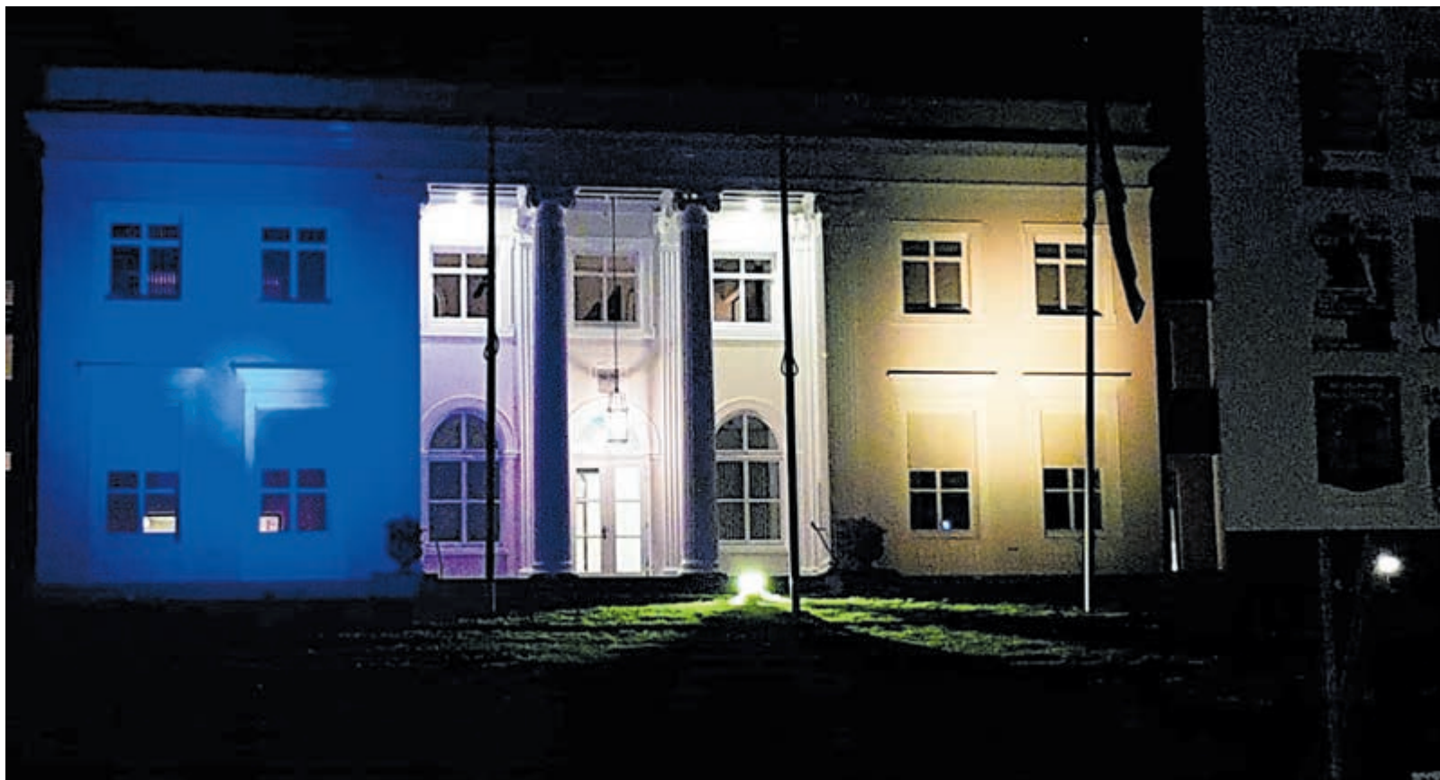
Gemeentehuis Bloemendaal in kleuren Oekraïne.