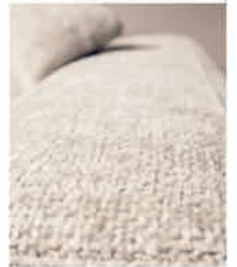
Loungebank Mia zoals afgebeeld v.a. 1199,- | Salontafel Established v.a. 388,- | Vloerkleed Muze v.a. 499,- | Hanglamp Julius v.a. 159,95 |