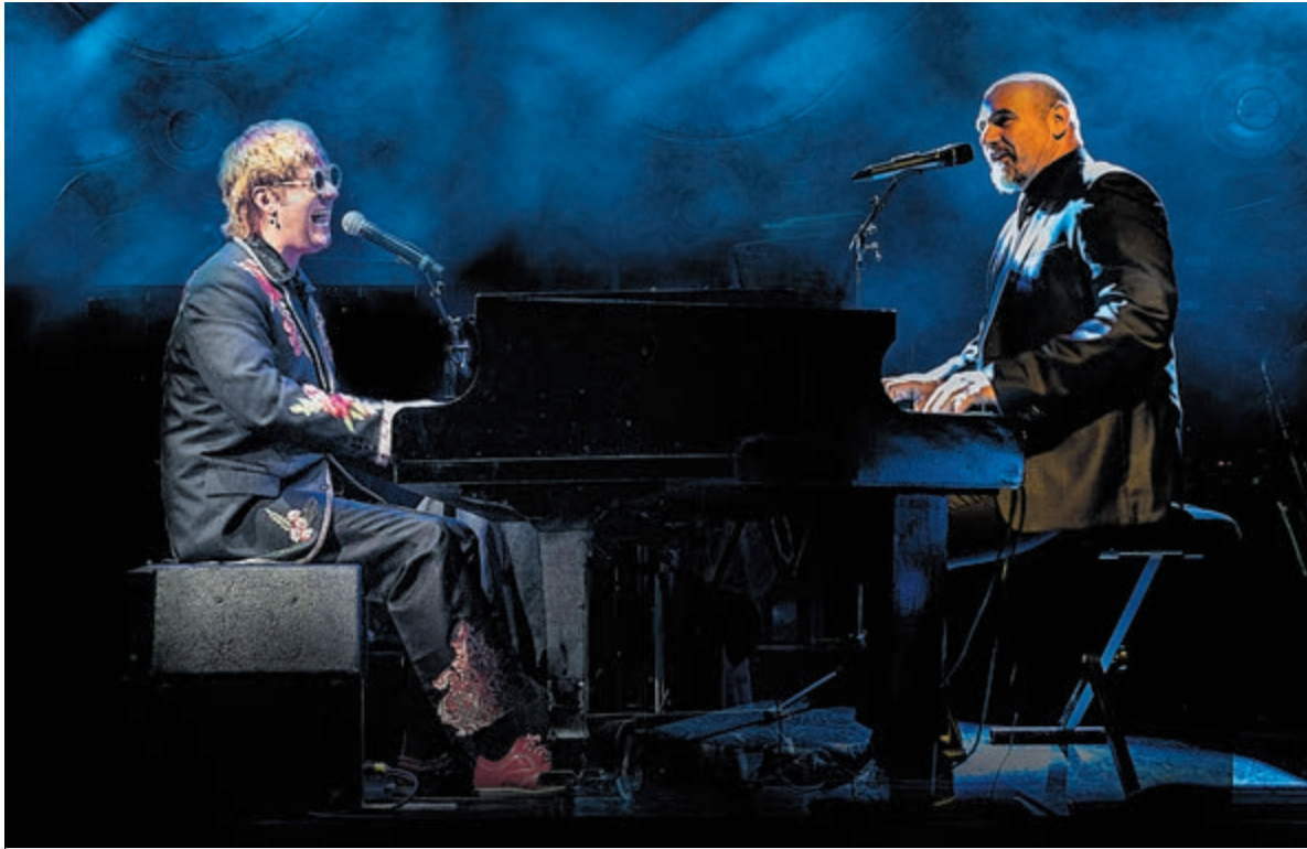
Elton John en Billy Joel.