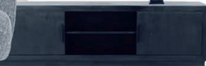
▲ Tv-meubel Jaxx 639,-