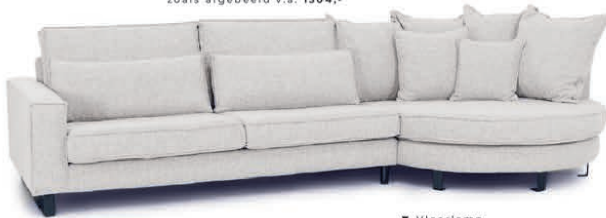
▼ Bankstel Maan zoals afgebeeld v.a. 1304,-