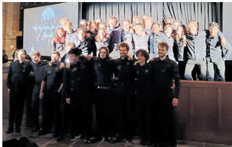
Het achtste Delft Hyperloop Team in de Nieuwe Kerk Delft.

European Hyperloop Week Zürich Met dit ontwerp zal het achtste Delft Hyperloop Team meedoen aan de European Hyperloop Week in Zürich, Zwitserland, waar ze net als vorige jaren de Complete Pod Design Award en beide Full-Scale Awards hopen te winnen. Vanaf half april zullen er tests plaatsvinden op een 40 meter lange baan naast de TU Delft D: Dreamhall. De testbaan splitst