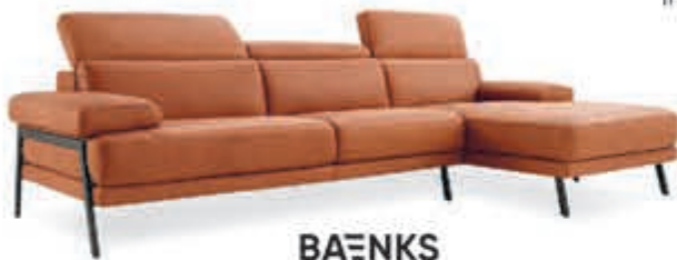
BAENKS Hoekbank 'Dadeland' Ergonomische topper. Verstelbare hoofdsteun. In leder Nouveau. Als afgebeeld Nu 5.199,- In stof vanaf 3.699,-