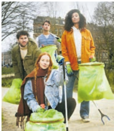
Landelijke Opschoondag op 23 maart.