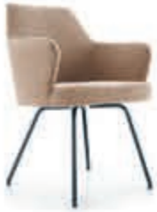
BAENKS Armstoel 'Rockingham' Dé eyecatcher aan tafel! In vele kleuren stof en leder of combi. In stof Vanaf 419,-