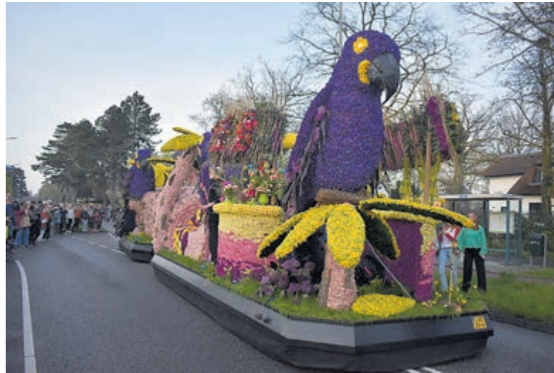
Bloemencorso 2023.