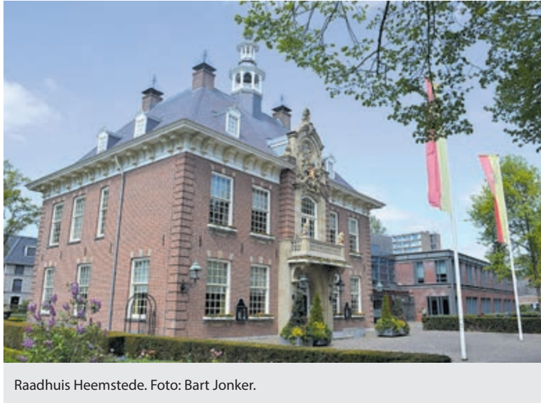
Raadhuis Heemstede.

Inwoners die de kosten niet zelf digitaal kunnen terugvragen kunnen langskomen tijdens de reguliere