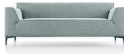
BAENKS Bank 'Bayside' Pocketvering met koudschuim. In stof, metalen poten. Als afgebeeld Nu 1.129,-