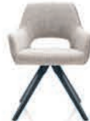
BAENKS Armstoel 'Cerretani' In stof Chronotex. Zwart eikenhouten onderstel met terugdraaisysteem. Nu 299,-