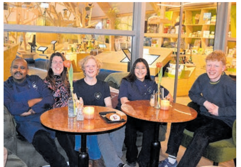
Het gastvrije team van Het Duincafé.