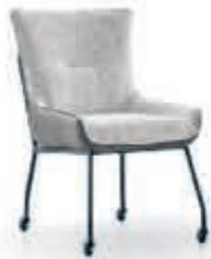
HOUSE OF DUTCHZ Eetstoel 'Dutchz 1800' Elegant model in stof Secret en leder Mombassa. Zwart frame en skatewielen Vanaf 379,-