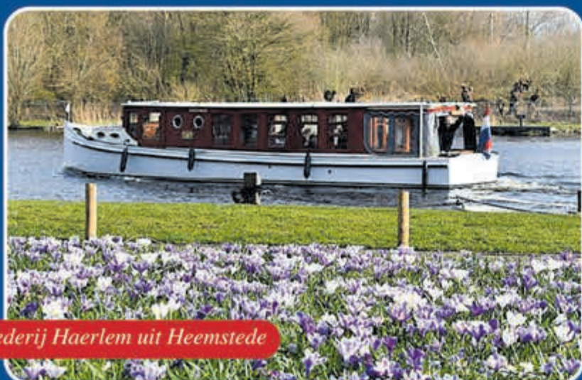
Rederij Haerlem uit Heemstede

Varen in Holland met de luxe salonboot 'Heerlijkheid'