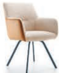
BAENKS Armstoel 'Via del Corso' Elegante eenvoud met ultiem zitcomfort. Uitgebreide stof- en ledercollectie en onderstellen. Als afgebeeld Nu 399,-