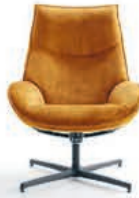
BAENKS Draaifauteuil 'Majani' Elegante uitstraling. Verstelbare rug en weerstand-mechanisme. In stof Adore. Vanaf 1.149,-