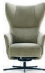
BAENKS Draaifauteuil 'Castleton' Comfortabele en volle zit- en rugkussens, sierlijke armen, metalen pootonderstel. In stof Regain Vanaf 1.399,-