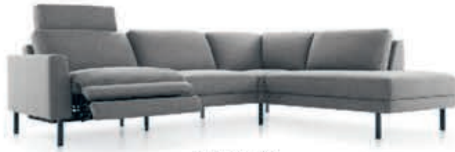
BAENKS Hoekbank 'Lord Street' Perfecte looks en ultiem zitcomfort. Vele mogelijkheden. Met relaxfunctie. In stof Vanaf 3.069,-