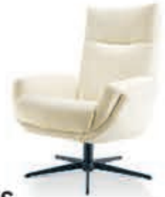
BAENKS Draaifauteuil 'Thames' Elegante draaifauteuil in Scandinavische stijl. In stof Santos. Metalen 5-teenspoet. Vanaf 679,-