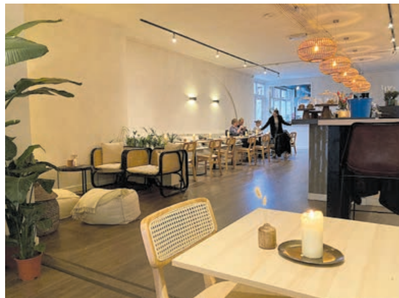
Een gezellig interieur.