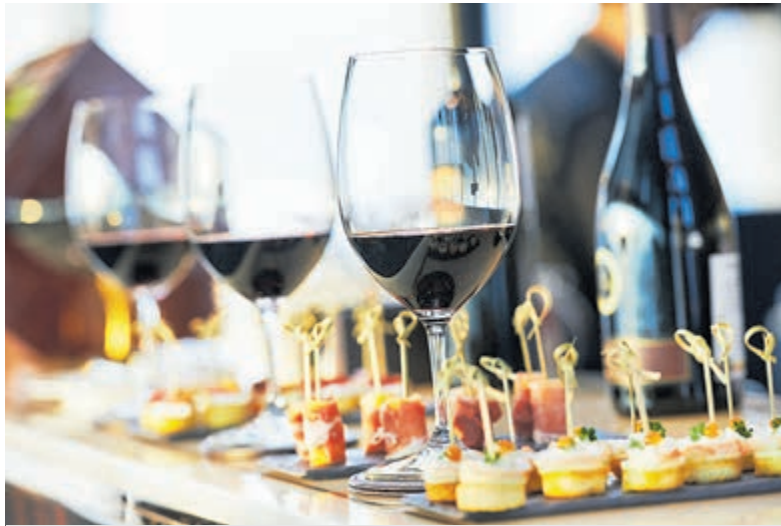
Een hapje en een drankje bij de Wijntour.

Wees er snel bij, want het aantal glazen is beperkt en ieder jaar weer snel uitverkocht. Het wordt weer genieten van een mooie avond!