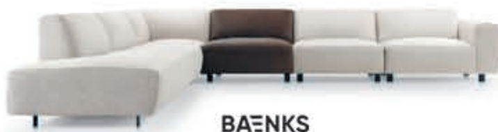
BAENKS Hoekbank 'Brentwood' In stof, één element in leder. Metalen poten. Als afgebeeld Nu 5.249,- In stof vanaf 3.969,-