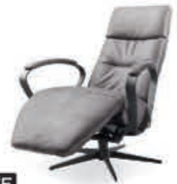
INHOUSE Relaxfauteuil 'Dock 5' In vele uitvoeringen, kleuren en materialen leverbaar. In microleder Kentucky. Maat M. Met open arm Nu 1.249,-