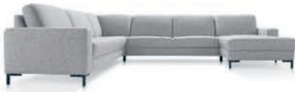
BAENKS U-Bank 'West End' Stevig zitcomfort door bonell-vering met afdeklaag van HR-schuim. Optioneel met slaapfunctie. Vanaf 3.419,-