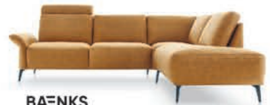
BAENKS Loungebank 'Jamison' Veel combinaties mogelijk. In stof, incl. hoofdsteun. Als afgebeeld Nu 2.109,-