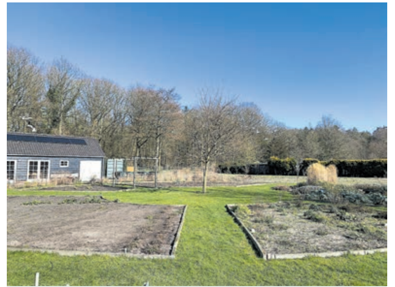
Kom In Mijn Tuin.

Ook dit jaar is alle hulp welkom op KIMT; er wordt een omheining gemaakt en de tuin moet weer 'zomerklaar' gemaakt worden. Er zal onkruid verwijderd moeten worden om alle perken weer mooi te maken en klaar voor de groei en bloei. Er wordt om 13.00 uur gestart en in de pauze is er koffie en thee met zelfgemaakte taart. ( www.kominmijntuin.com of Facebook: Kom In Mijn Tuin.)