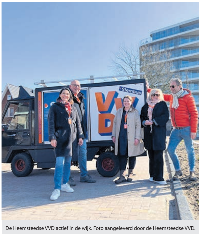
De Heemstedse VVD actief in de wijk.

Samen met bewonersgroepen voerden de VVD afgelopen periode effectief oppositie. In de komende vier jaar wil de partij meebesturen om meer te bereiken. Mag de Heemstedse VVD op uw vertrouwen en uw stem rekenen? Het programma is te vinden op: www.vvdheemstede.nl .