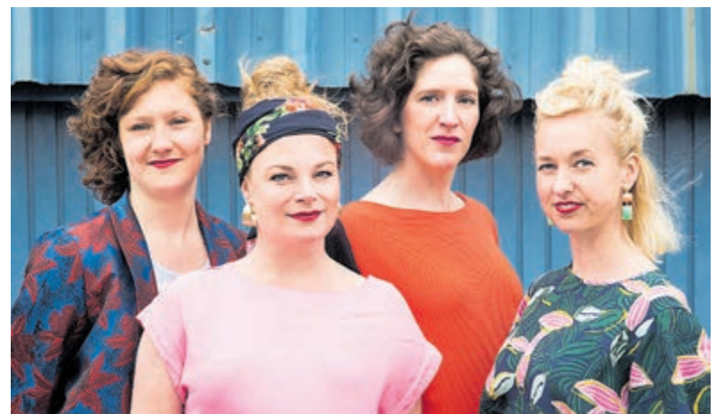
Ragazze Quartet.

Alkmaar 072-5312000 Haarlem 023-5121400 Velsen 0255-547800