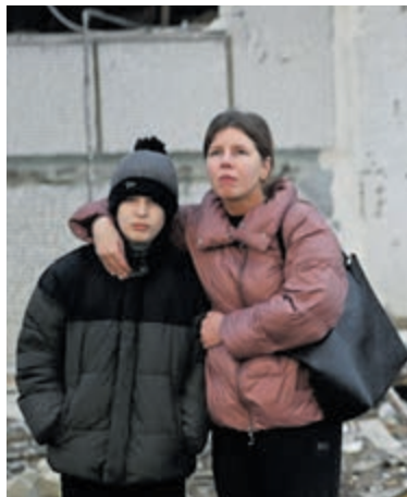
Oorlogssituatie in Oekraïne.

Dorcas is een christelijke organisatie voor noodhulp en internationale samenwerking. Dorcas investeert in duurzame verandering in het leven van mensen die achtergesteld zijn. Dorcas komt in actie bij armoede, uitsluiting en crisis en creëert mogelijkheden voor mensen en gemeenschappen om tot bloei te komen. Dorcas heeft verspreid over heel Nederland 42 kringloopwinkels. Duizenden vrijwilligers en donateurs