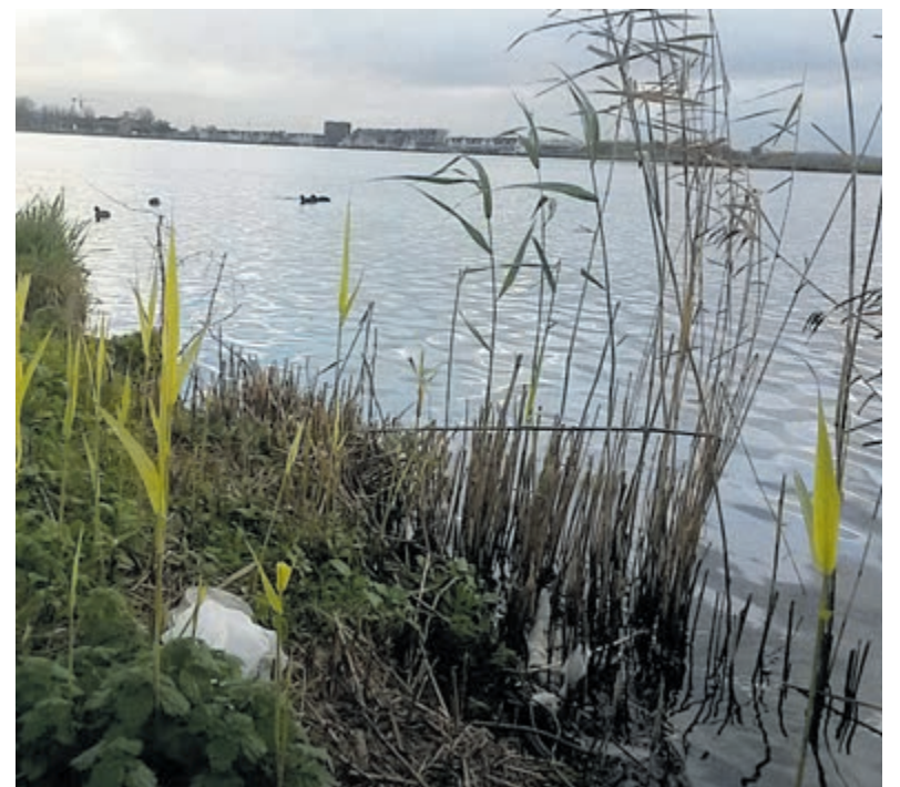
Spaarne-oever. Foto aangeleverd.

Locatie: Kanovereniging De Trekvogels. Spaarndamseweg 25, Haarlem.