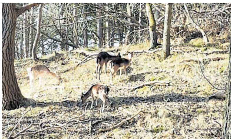
Herten in duingebied.