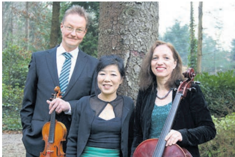
Hobbema pianotrio. Foto aangeleverd.

Het concert begint om 15 uur. Na het concert wordt om een bijdrage tussen de 5 en 10 euro gevraagd om de kosten te dekken, wat overblijft is