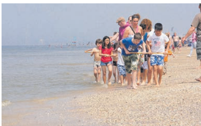
Vissen met een kor.

Reserveren/aanmelden via: www.np-zuidkennemerland.nl . Informatie dinsdag t/m zondag via 023-5411123.