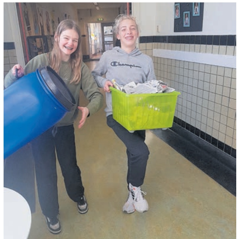
Leerlingen Vondelschool in actie voor Oekraïne.

Al snel werd besloten dat er iets gedaan moest worden om geld in te zamelen voor giro 555. De leerlingen gingen voortvarend aan de slag en door hun enthousiasme doet inmiddels de hele school mee, inclusief de leerkrachten. Omdat de kinderen uit Aerdenhout op het jeugdjournaal zien dat andere kinderen moeten vluchten zijn ze erg betrokken. De