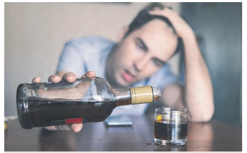
Overmatig drinken.

Regio - Dit is het moment om fraaie zonsondergangen vast te leggen, zoals hier op de foto. Een van de fraaie gezichten met helder weer die deze periode rijk is.