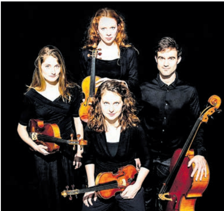
Het Belifante Quartet.

Vijfhuizen - In het Kunstfort bij Vijfhuizen aan Fortwachter 1 treedt zaterdag 12 maart om 20.15 uur het Belifante Strijkkwartet op. Zondagmiddag 13 maart om 14 uur verzorgt sterpianiste Nino Gvetadze er een concert. Hoewel hij het genre van het strijkkwartet niet heeft uitgevonden, geldt componist Joseph Haydn als de grondlegger van het moderne strijkkwartet. Het Belifante Strijkkwartet is er een meester in dit bijzondere genre te laten ervaren. Deze vier muzikanten treden sinds 2016 op door heel Nederland en Europa. Ze combineren de kern van het strijkkwartet-repertoire met minder bekende werken. Op het Cruquius-concert maken ze een kleine reis door de strijkkwartettentijd: van Playford 1651, via Britten 1936 en 1945 naar Shaw 2015.