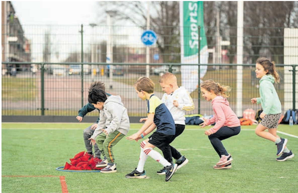
Sport is onmisbaar.

Marije: "Wel is er een duidelijke transitie gaande. Steeds meer artsen en zorgverleners verbreden hun blik en ook het feit de GLI (gecombineerde leefstijlinterventie, gericht op een positieve gedragsverandering van mensen met overgewicht) deels vergoed wordt, is een stap in de goede richting. Maar willen we sport