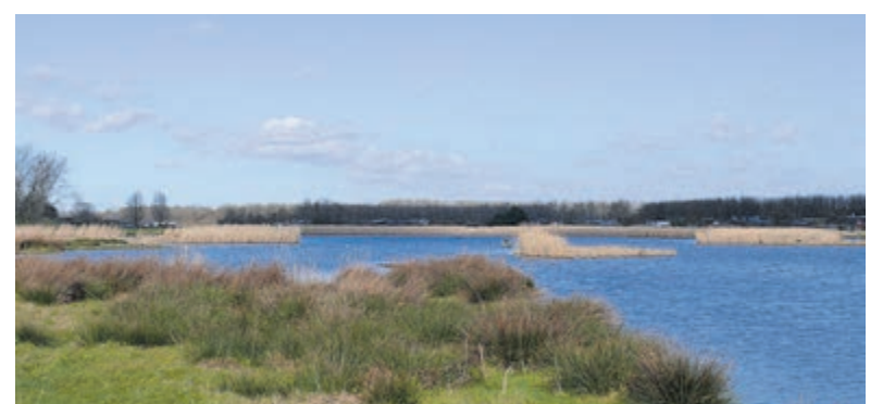
Landje van Gruijters Spaarndam. Foto aangeleverd.