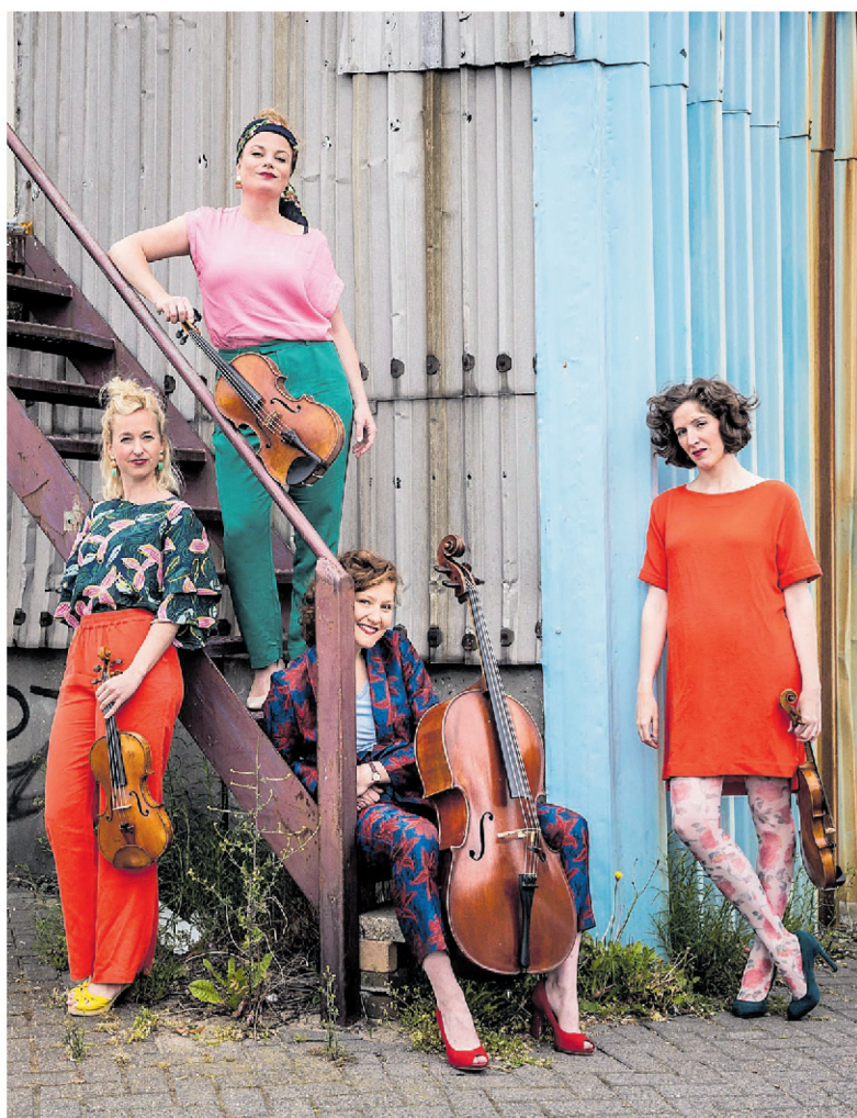
Ragazze Quartet.

Toegangsprijs inclusief consumptie: €25,-. Zaal open: 19.30 uur. Kaarten te bestellen via de website www.CruquiusConcerten.nl of via Stichting CruquiusConcerten, p/a Anne Franklaan 64, 2135 HB Hoofddorp, telefonisch: 023-529 3204.