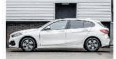
BMW 1-serie 118i € 26.750,-