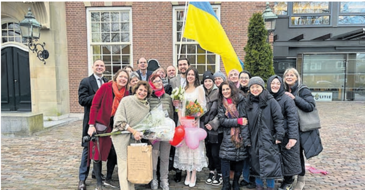
Het echtpaar in het midden samen met hun landgenoten. Foto aangeleverd.

Ook namens de Heemsteder wordt het paar veel geluk en een mooie vreedzame toekomst toegewenst.