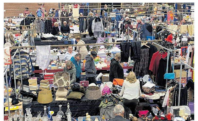
Vlooiemarkt in Sportplaza Groenendaal.

Voor meer informatie of reserveringen kunt u bellen naar: organisatiebureau MIKKI, tel.nr.: 0229-24 47 39 of 24 46 49. Of kijk op internet: www.mikki.nl .