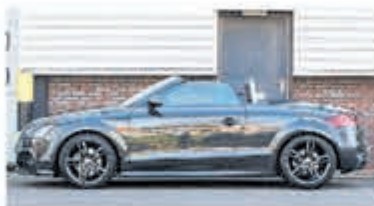
Audi TT 1.8 TFSI Roadster Adv. Sp. € 23.950,-