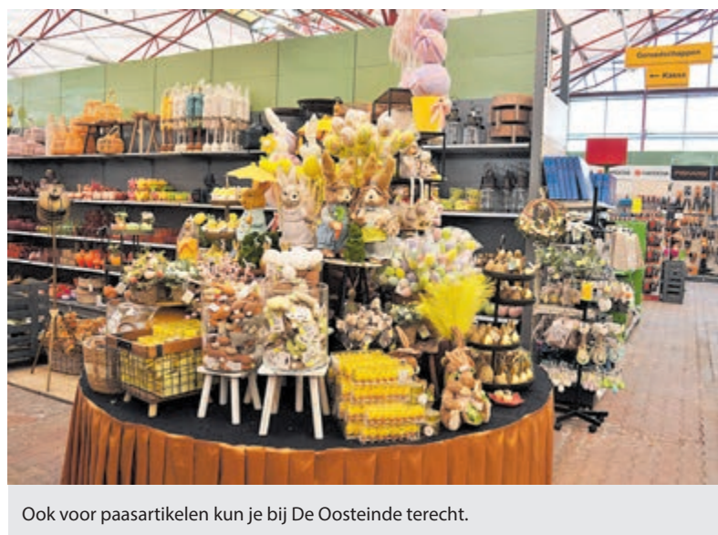
Ook voor paasartikelen kun je bij De Oosteinde terecht.

daad je ogen uit. Een groot assortiment van planten en bloeiende bloemen in de fraaiste kleuren geuren je tegemoet en zijn een lust om te zien. Je krijgt gewoon inspiratie en zin om aan de slag te gaan. Niet alleen voor planten en bloemen kun je slagen, maar eveneens heeft De Oosteinde een groot assortiment smaakvolle artikelen om je huis en tuin te decoreren, benodigdheden voor je huisdier en een uitgebreid assortiment van accessoires. Ook de fraaie paasafdeling is een bezoekje waard. Zondag 5 maart is De Oosteinde aan de Schipholweg 1088 in Vijfhuizen geopend.