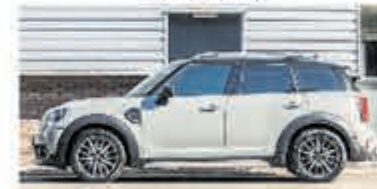
Mini Countryman 2.0 Cooper D € 17.950,-