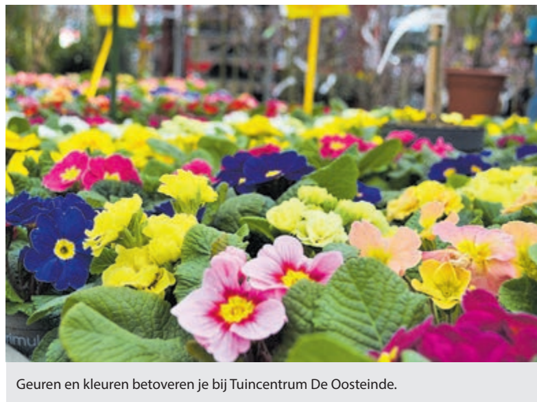
Geuren en kleuren betoveren je bij Tuincentrum De Oosteinde.