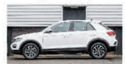
Volkswagen T-Roc 1.0 TSI € 20.950,-

Turenhout de occasiondealer van Heemstede en al meer dan 40 jaar uw vertrouwde onderhoudsadres.