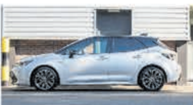
Toyota Corolla 2.0 Hybrid Dynamic € 26.700,-