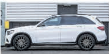
Mercedes-Benz GLC-klasse 250 d 4MATIC Luchtvering € 41.900,-