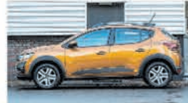
Dacia Sandero 1.0 TCe Comfort € 22.950,-