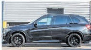
BMW X5 xDrive40e M Sp. Ed. € 56.900,-