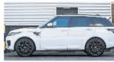
Land Rover Range Rover Sport P400e HSE € 101.950,-