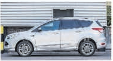
Ford Kuga 1.6 Titanium Pl. 4WD € 18.450,-