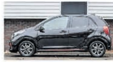
Kia Picanto 1.0 DPI GT-Line € 17.900,-