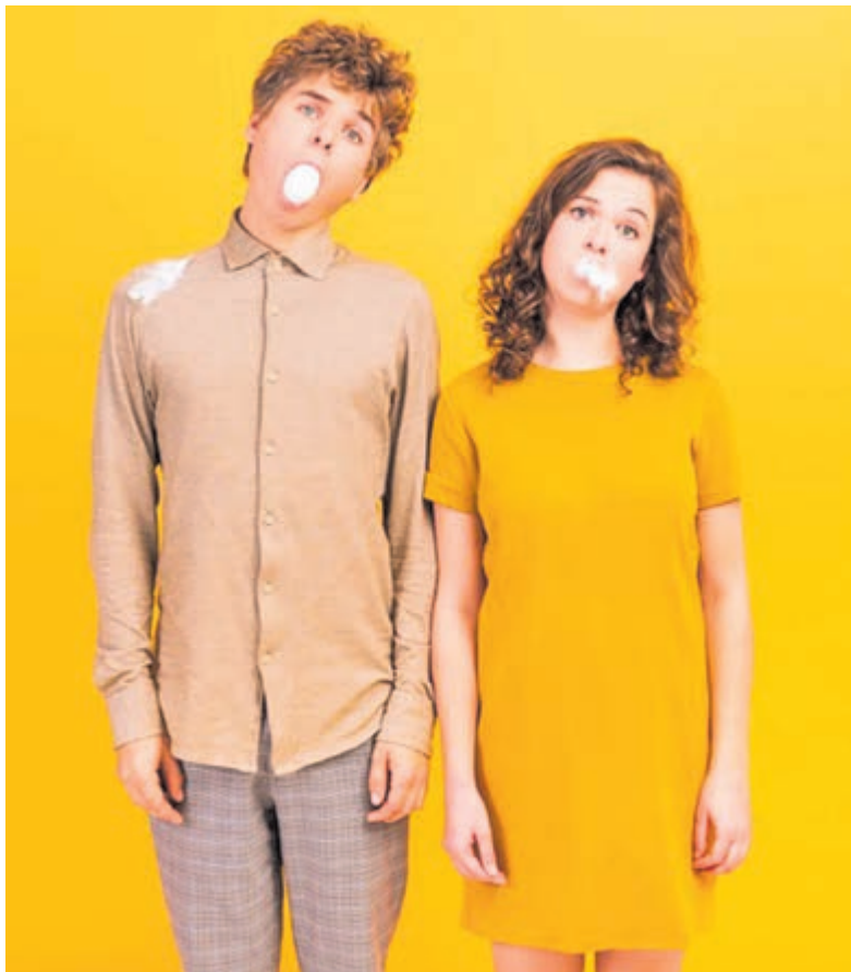
Cabaretduo Grof Geschud.

Hexagon ensemble - Panorama Beethoven: 30-jarig jubileumconcert. Oude Kerk, Wilhelminaplein, Heemstede. Om 20.15u. Kaarten en informatie: www.podiaheemstede.nl .