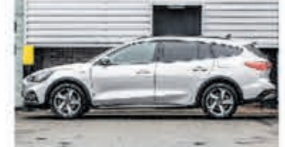
Ford Focus Wagon 1.0 EcoB. Tit. Bns € 26.900,-