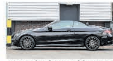
Mercedes-benz C-klasse 220 d Cabrio Premium Pack € 41.900,-