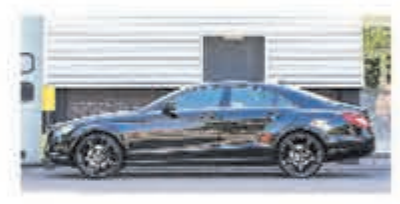
Mercedes-benz CLS-klasse 350 € 20.750,-