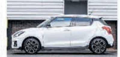
Suzuki Swift 1.4 Sport Sm. Hyb. € 22.700,-