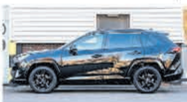
Toyota RAV4 2.5 Hybrid AWD Enrg+ € 39.950,-