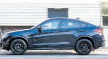
BMW X4 xDrive28i High Exec. € 36.950,-