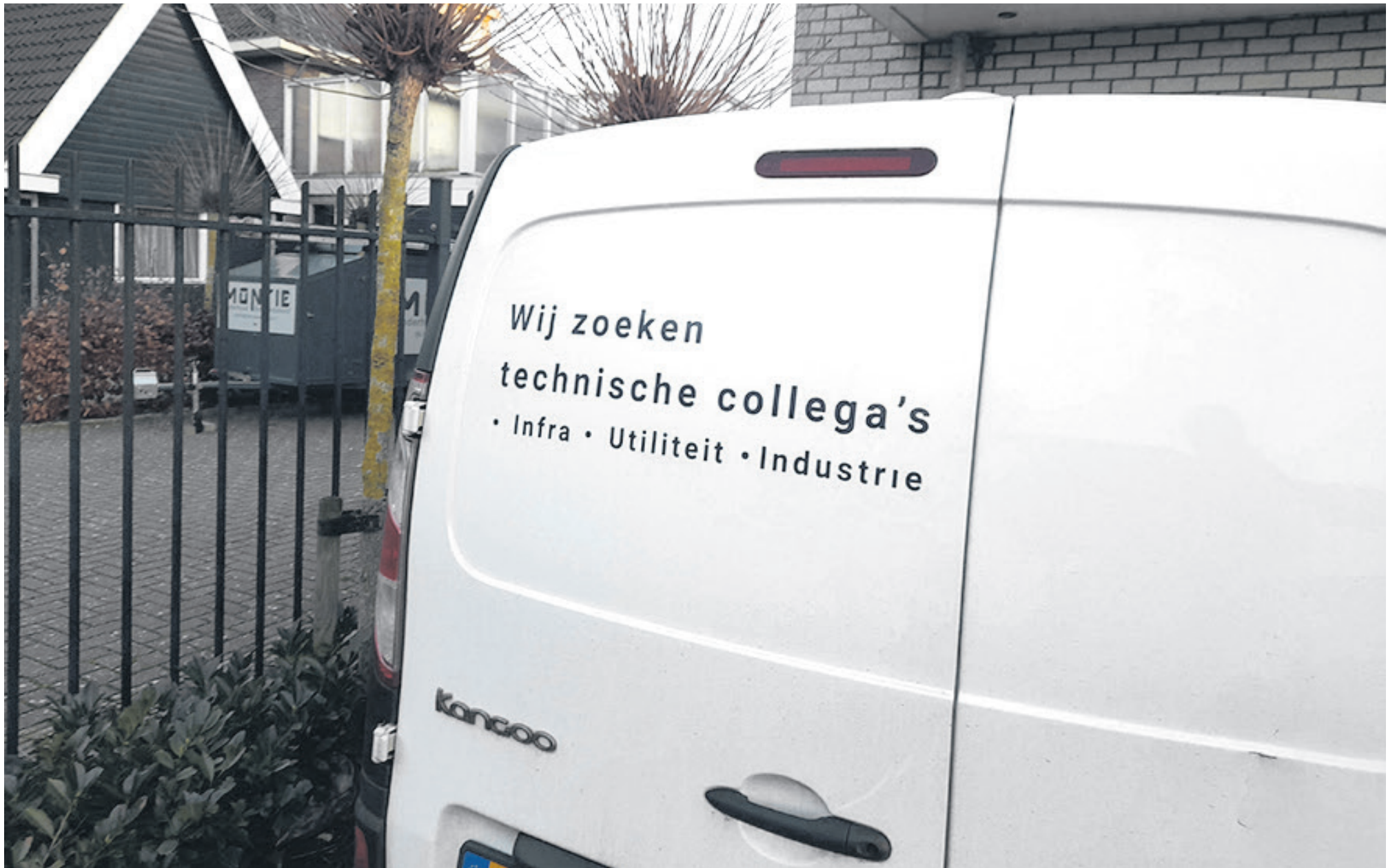
Steeds meer bedrijven hebben moeite om aan gekwalificeerd personeel te komen.