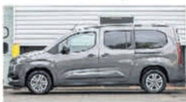
Toyota PROACE Verso CITY 7 pers. 1.2 T Act. Long 7p € 33.016,- excl. btw