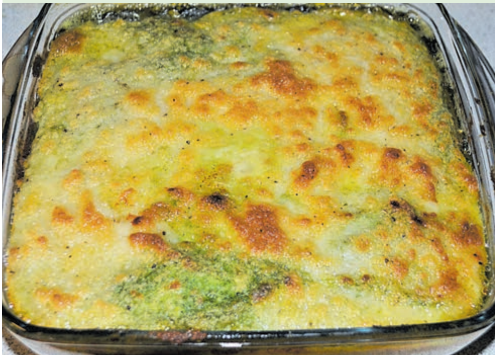
De schotel cannelloni.

Een rode Nero d'Avola uit Sicilië. Buon appetito.