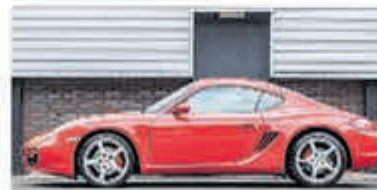
Porsche Cayman S Tiptronic Uniek 80.000 km € 29.950,-