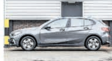
BMW 1-serie 116d Sp.Line Edition € 26.950,-