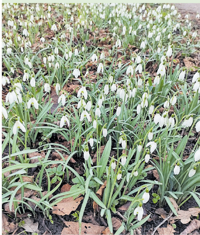
Fraaie tapijtjes van sneeuwkllokjes ( Galanthus nivalis ) tussen de bomen in Leyduin.

Het sneeuwkllokje kent wel 19 verschillende varianten. In Nederland zijn onder andere naast het gewoon sneeuwkllokje in stinsmilieus ook Galanthus elwesii en Galanthus woronowii te vinden, die kleine onderlinge verschillen vertonen. Het sneeuwkllokje is wel een giftige plant.