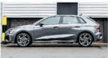
Audi A3 Sportback 35 TFSI S edition € 42.950,-