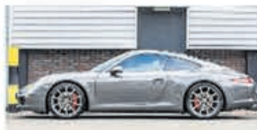
Porsche 911 3.8 Carrera S € 84.900,-