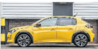
Peugeot 208 1.2 PureTech GT-Line € 25.950,-