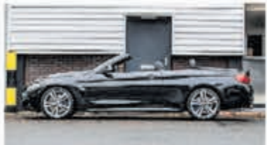
BMW 4-serie Cabrio 440i Cent Hi Exec € 41.950,-