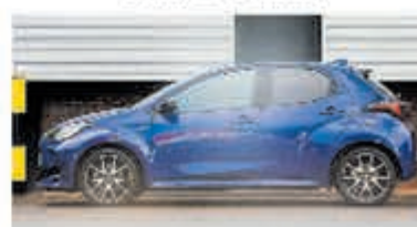
Toyota Yaris 1.5 Hyb. Executive € 25.700,-