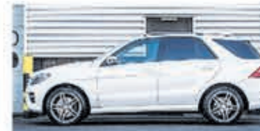
Mercedes-benz M-klasse 350 € 34.950,-