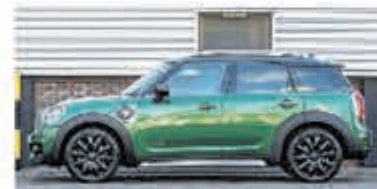
Mini Countryman 1.5 Co.S E ALL4 Chill € 36.700,-