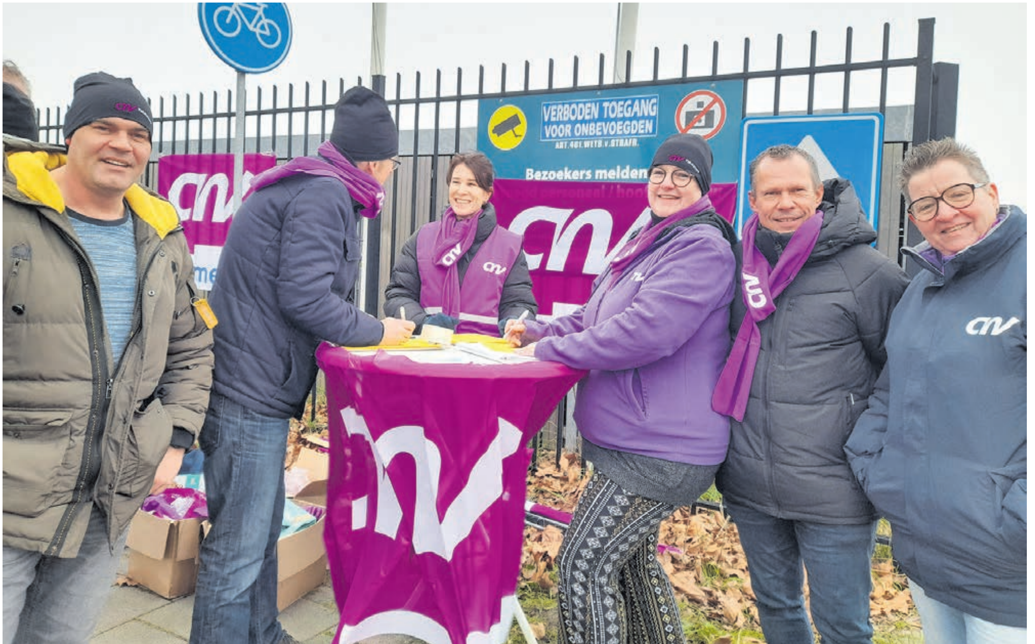
Chauffeurs in het streekvervoer staken voor een hoger loon en een verlaging van de werkdruk.