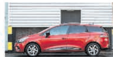
Renault Clio Estate 1.2 TCe Zen. € 15.950,-