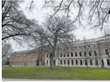
Het provinciehuis van Noord-Holland in Haarlem.

Het college van gedeputeerden bestaat nu in Noord-Holland uit zes vertegenwoordigers die na coalitieonderhandelingen gekozen zijn. Het ligt aan de uitkomst van de coalitieonderhandelingen hoeveel gedeputeerden er straks komen. Landelijk ligt het aantal gedeputeerden tussen de drie en de zeven. Het college onder voorzitterschap van de commissaris vormt het dagelijks bestuur. Dit bestuur zorgt voor de dagelijkse uitvoering van de provinciale taken. In de vergaderingen krijgen zij te maken met de statenleden die via wijzigingen, voorstellen, amendementen en moties het bestuur kunnen dwingen andere routes te kiezen dan voorgenomen. De staten vergaderen eenmaal per maand in