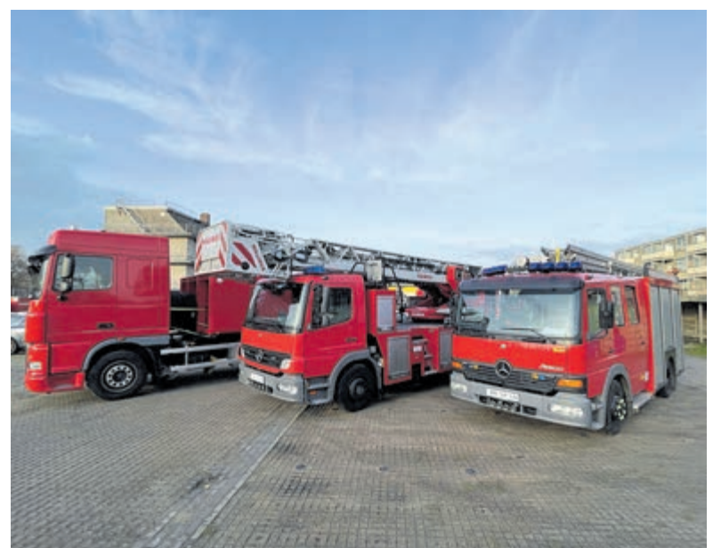
Brandweer Kennemerland schenkt drie wagens en materieel aan Oekraïne.

Het materieel dat is geschonken, is in goede staat, maar al wat ouder en voldoet niet meer aan de Nederlandse eisen. Dat betekent dat er voor die wagens en spullen al nieuw materieel is aangekocht. De geschonken spullen worden ontdaan van herkenbare striping. Meestal wordt afgeschreven materiaal geveild waarna de opbrengt binnen Kennemerland weer terugvloeit naar de eigen begroting. Nu helpt de Kennemerlandse brandweer er een brandweerkorps in Oekraïne mee, hulp die daar maar al te goed gebruikt kan worden.