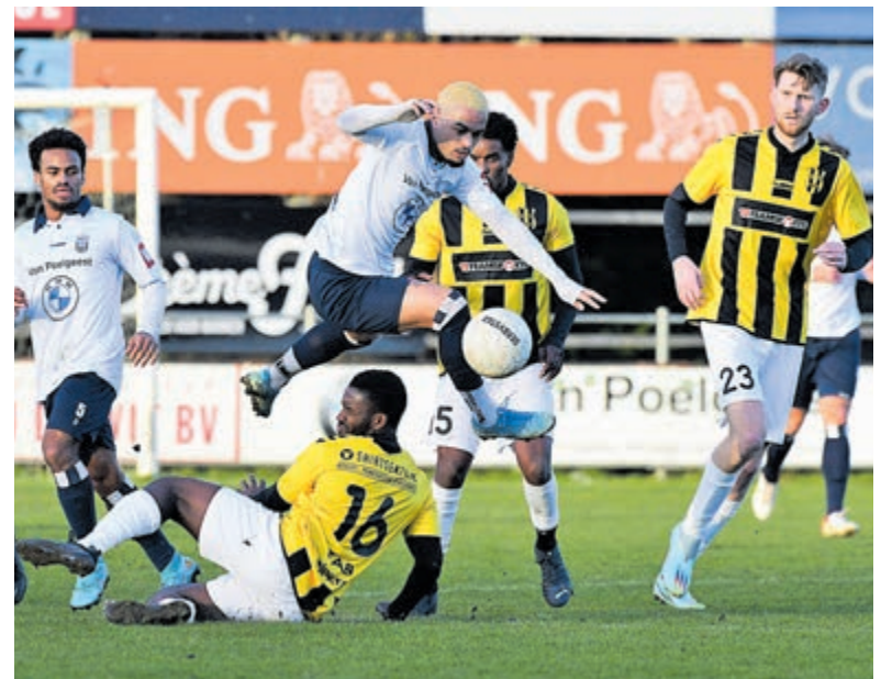
Kon. HFC tegen OFC.

Volgende week gaat HFC naar Amsterdam voor een topwedstrijd tegen koploper AFC.