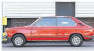
BMW 02-serie 1802 Touring € 14.950,-