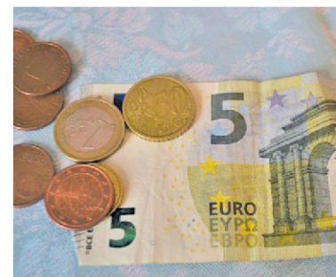
Zorgtoeslag checken kan lonen.

Vanaf nu kunnen ook ouderen die geen lid zijn van ANBO (tegen een geringe betaling) gebruikmaken van de Belastinghulp. Meer informatie hierover is te vinden op: www.belastinginvalhulp.nl/ .