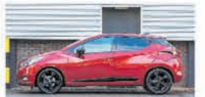
Nissan Micra 1.0 IG-T N-Sport € 19.950,-