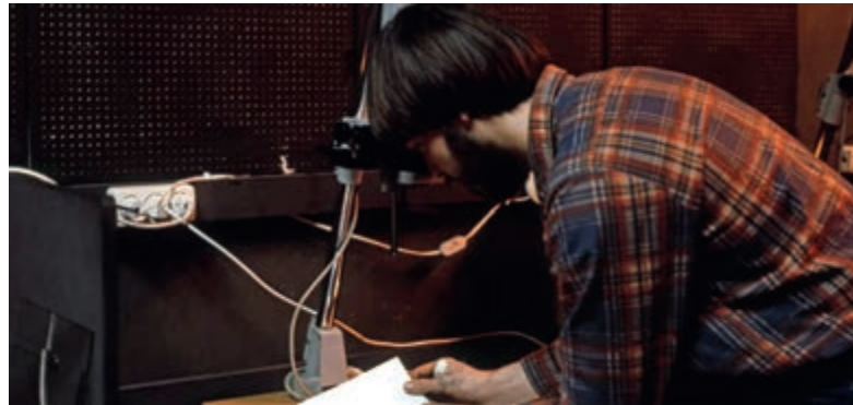
Een van de leden geconcentreerd bezig in de goed geoutilleerde Doka van 'Het Ogenblik'.

Heemstede - Marco, Ton, Sander en Aad, zoeken oud-leden van Jeugdfotoclub 'Het Ogenblik' om na vele jaren een reünie te organiseren. Er is een aantal namen achterhaald, maar helaas missen er nog veel. Met deze oproep hoopt de organisatie veel reacties te krijgen met veel informatie en indien mogelijk materiaal van die succesvolle periode van de fotoclub. Datum: 20 april a.s., inloop 14.30 uur. Details over locatie en programma volgen z.s.m. Reacties kunnen gemaaild worden naar info@aad-design.nl .