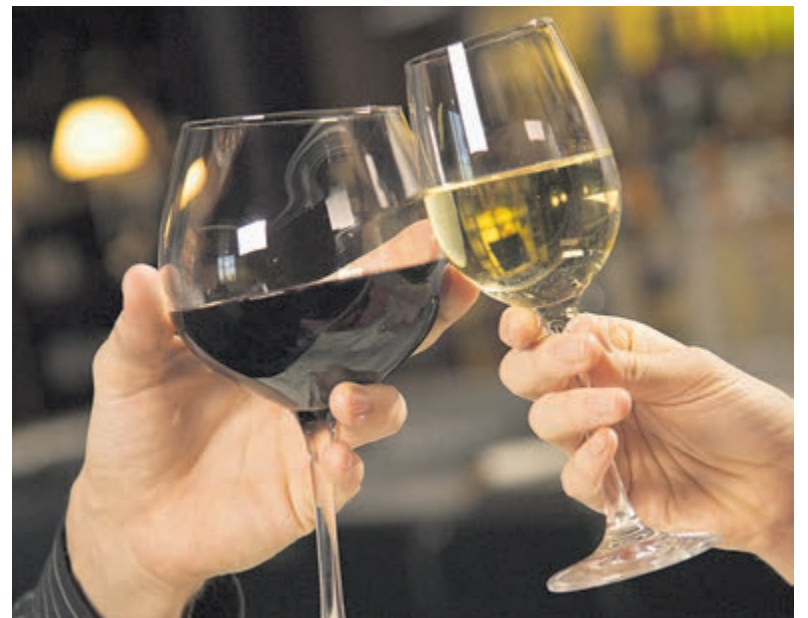
Gezellig met elkaar proosten tijdens De Wijntour.

Wees er snel bij, want het aantal glazen is beperkt en ieder jaar weer snel uitverkocht. Het wordt weer genieten van een mooie avond!