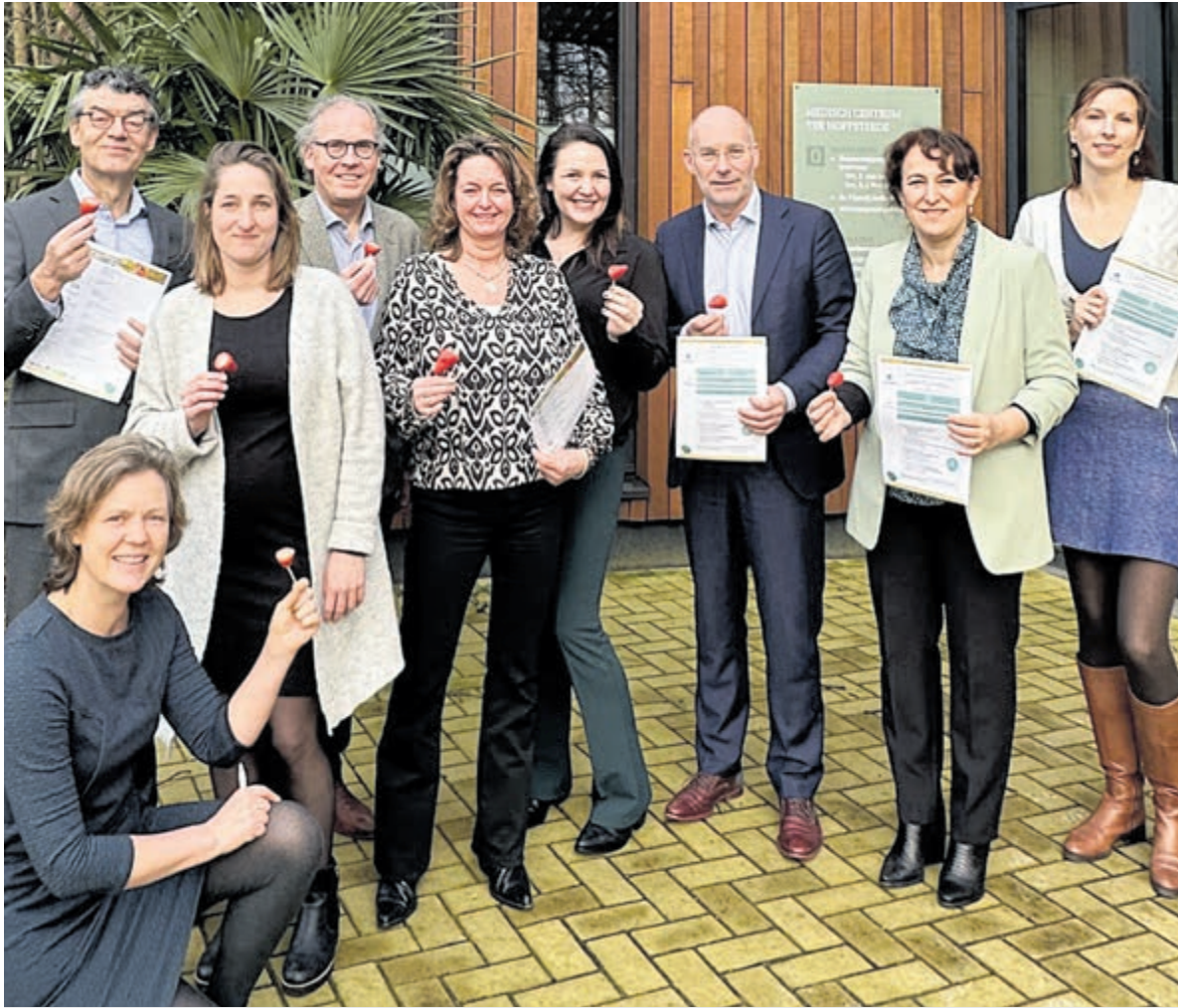
Na het tekenen van de samenwerking was er een fotomoment voor huisartsenpraktijk Overveen. Daar gezondheid hand-in-hand gaat met goede voeding kregen alle betrokkenen van de gemeente een stuk fruit aangeboden.