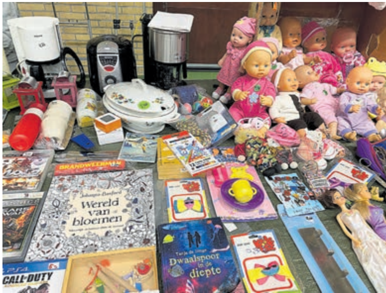
Voor ieder wat wils op de vlooiemarkt.

Voor meer informatie of reserveringen kunt u bellen naar: organisatiebureau MIKKI, 0229-24 47 39 of 24 46 49. Of kijk op internet: www.mikki.nl .