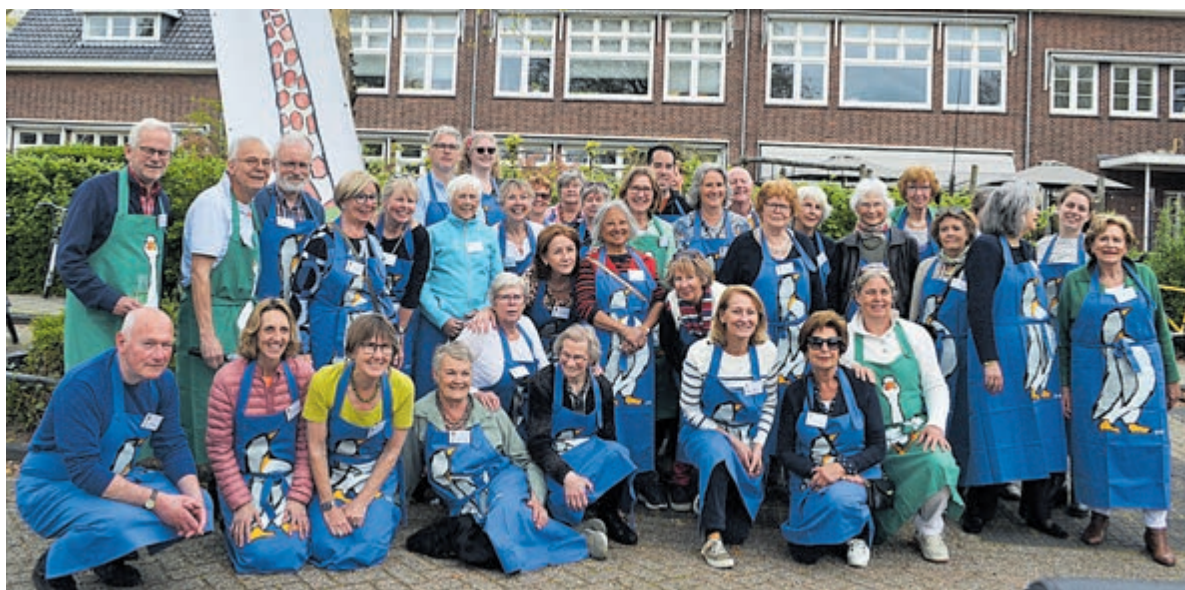
De vrijheidslunch HEEMSTEDE HAPT in 2023.

Hard nodig, want de stichting is wars van opgeplakte etiketten, stigma's en hokjesgeest. De stichting IK ZIE JE WEL heeft als doel deze stigma's weg te nemen en de saamhorigheid in de gemeenschap te bevorderen en eenzaamheid en isolement te voorkomen. Niemand, maar dan ook niemand mag worden uitgesloten. "Vooral mensen met een psychische kwetsbaarheid worden hard geraakt in deze tijd van voortdurend presteren, perfectie en materialisme", legt Ellen uit. "Het stigma dat ze opgeplakt krijgen uit vooroordelen door onwetendheid bezorgt ze een gevoel niets waard te zijn. Ze dreigen geïso-