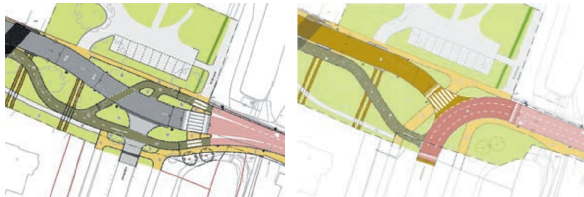
De beide varianten: spaghetti-variant (l) en de hangbuikzwijn-variant (r).