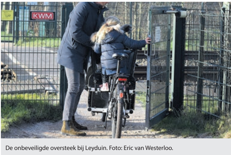
De onbeveiligde oversteek bij Leyduin.

Heemstede – Er komt geen nieuw tunneltje onder het spoor bij Leyduin. Tot ongenoegen van veel inwoners, vooral van hen die soms dagelijks gebruik maken van de onbeveiligde oversteek van het spoor dat toegang geeft tot natuurgebied Leyduin. Zij waren voor niets gekomen. Het besluit helemaal te stoppen met het bouwen van een tunneltje was in 2023 al genomen. Maar liefst 16 insprekers hadden de moeite genomen tijdens commissievergadering op 15 februari hun mening te geven. Allen benadrukten dat de oversteek een must is als je lopend of fietsend Leyduin wil bereiken.