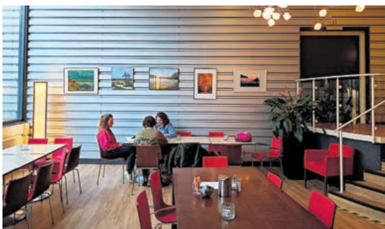
Werk van cursisten in de Luifel. Foto's aangeleverd.