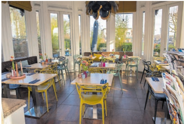
De gezellige inrichting van De Wachtkamer.