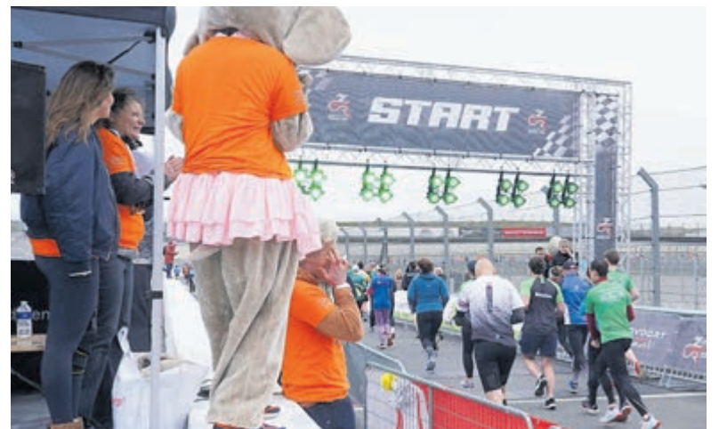
Lopers in de bres voor Villa Joep op Zandvoort Circuit Run. Beeld aangeleverd.

het geeft net een andere betekenis en motivatie aan het hardlooptoernooi. Donateurs kunnen de lopers aanmoedigen met een persoonlijk bericht. En zo weet de organisatie dat ze meerrennen voor Villa Joep. Er wordt een hardloophshirt voor ze gereserveerd (zolang de voorraad strekt) en ze kunnen bij de Villa Joep tent op het terrein hun startnummer omspelden, fruit, een hapje en een drankje komen halen. Ze kunnen gratis een skate-clinic volgen van het Reggeborgh schaatsteam of bij de tent een hotdog halen. Allemaal leuke voordelen om in het Villa Joep team mee te lopen. Vergeet niet om je zelf ook in te schrijven bij de Zandvoort Circuit Run! (t/m 10 maart). Via hen ontvang je een startnummer. Er zijn verschil-