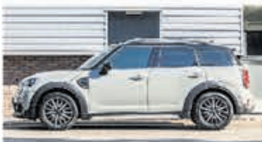
Mini Countryman 2.0 Cooper D € 17.950,-