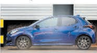
Toyota Yaris 1.5 Hyb. Executive € 25.700,-

Turenhout de occasiondealer van Heemstede en al meer dan 40 jaar uw vertrouwde onderhoudsadres.