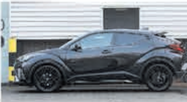
Toyota C-HR 1.8 Hybrid Style Limited Edition € 31.950,-