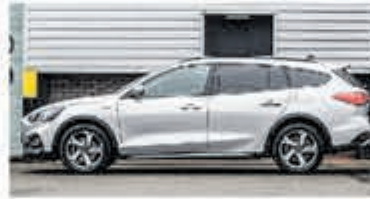
Ford Focus Wagon 1.0 EcoB. Tit. Bns € 26.900,-