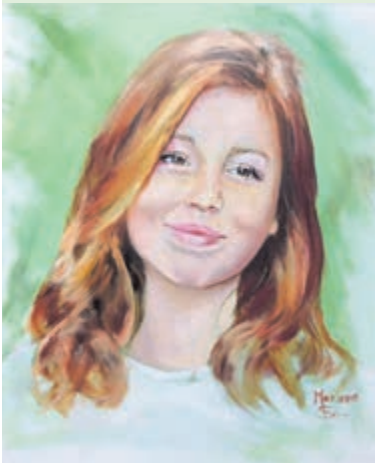
Werk van Marleen Straver.

U kunt de expositie dagelijks bezoeken tussen 11-17 uur. De expositie is openbaar toegankelijk in de gangen op de begane grond van Zuiderhout.