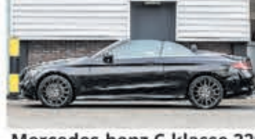
Mercedes-benz C-klasse 220 d Cabrio Premium Pack € 41.900,-