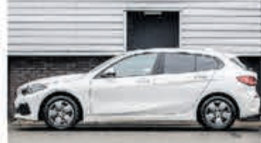
BMW 1-serie 118i € 26.750,-