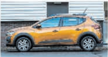
Dacia Sandero 1.0 TCe Comfort € 22.950,-