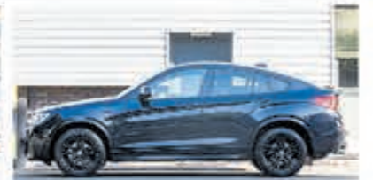
BMW X4 xDrive28i High Exec. € 36.950,-