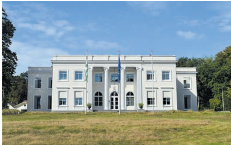
Gemeentehuis Bloemendaal.