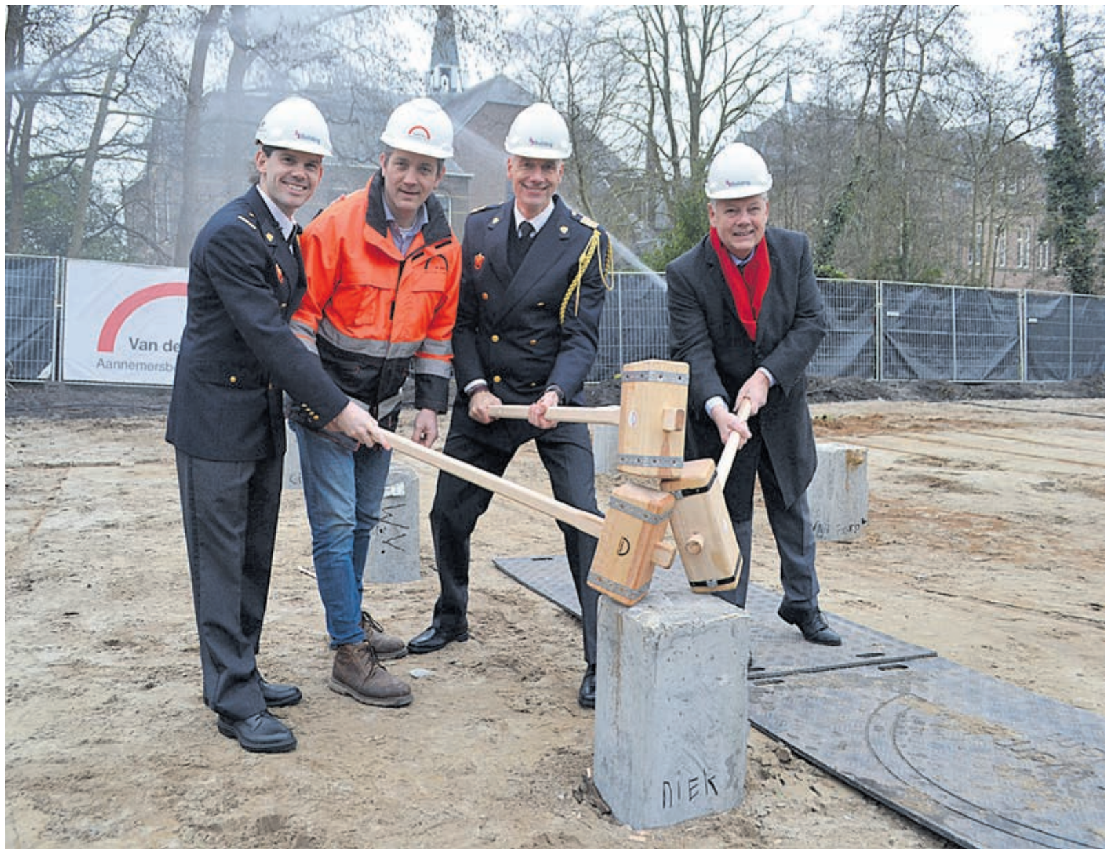
Symbolisch werd de eerste heipaal ingeslagen voor de nieuwe brandweerkazerne.

"Ik had mezelf voorgenomen om dit project volledig van de grond te trekken tijdens mijn burgemeesterschap en ik ben er trots op dat dit is gelukt. In goed harmonieus overleg tussen buurtbewoners, brandweer