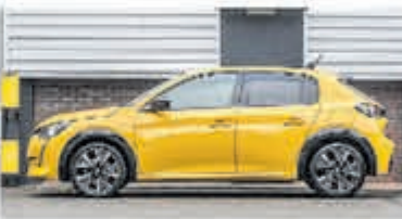
Peugeot 208 1.2 PureTech GT-Line € 25.950,-