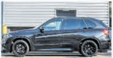
BMW X5 xDrive40e M Sp. Ed. € 57.900,-