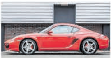
Porsche Cayman S Tiptronic Uniek 80.000 km € 29.950,-