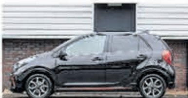
Kia Picanto 1.0 DPi GT-Line € 17.900,-