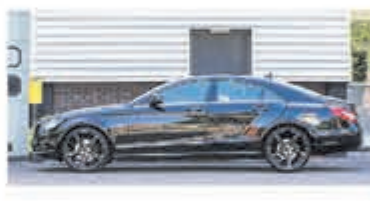
Mercedes-benz CLS-klasse 350 € 20.750,-