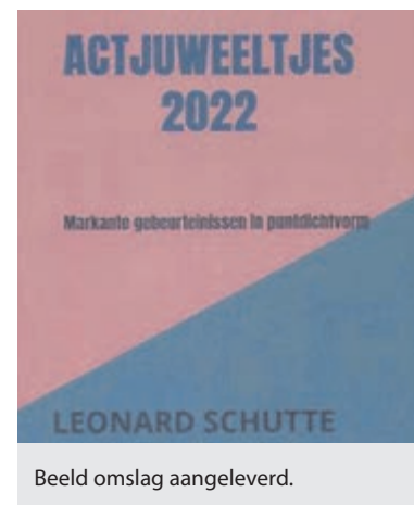
Beeld omslag aangeleverd.

Deze gedichtenbundel wordt sinds woensdag 25 januari uitgegeven door Uitgeverij Brave New Books. Boekgegevens 'Actjuweeltjes 2022, markante gebeurtenissen in puntdichtvorm' door Leonard Schutte ISBN: 99789464800722, verkoopprijs: € 13,-.