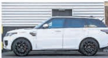
Land Rover Range Rover Sport P400e HSE € 101.950,-