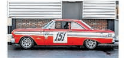
Ford Usa Falcon FUTURA SPRINT € 79.000,-