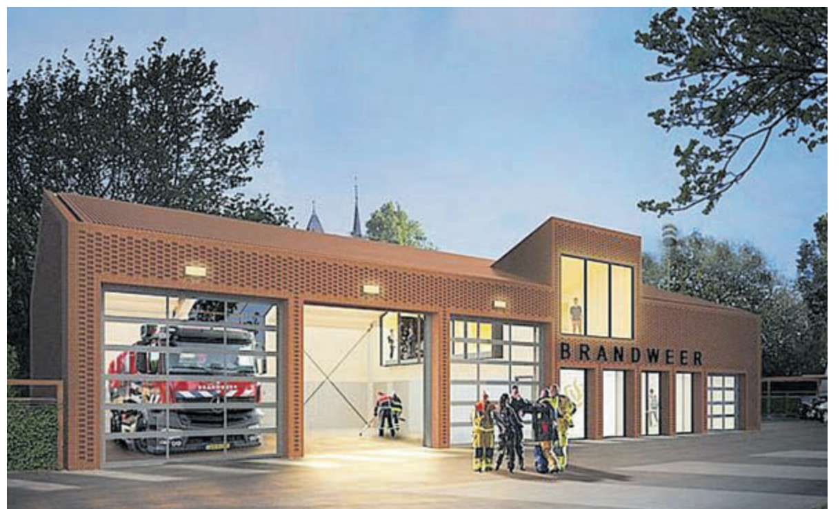
Ontwerp nieuwe brandweerkazerne.

De buitendienst van de gemeente Bloemendaal gaat tevens gebruik maken van een ruimte in de nieuwe kazerne. Daarnaast stalt de buurtbusvereniging de buurtbus op het terrein.