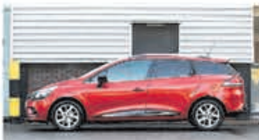
Renault Clio Estate 1.2 TCe Zen. € 15.950,-