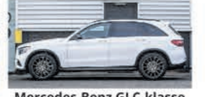
Mercedes-Benz GLC-klasse 250 d 4MATIC Luchtvering € 41.900,-