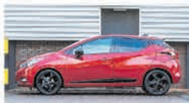
Nissan Micra 1.0 IG-T N-Sport € 19.950,-