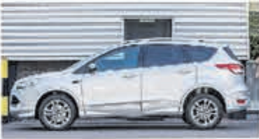
Ford Kuga 1.6 Titanium Pl. 4WD € 18.450,-