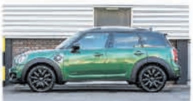
Mini Countryman 1.5 Co.S E ALL4 Chill € 36.900,-