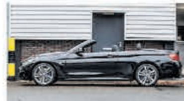
BMW 4-serie Cabrio 440i Cent Hi Exec € 41.950,-