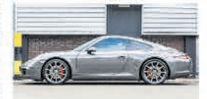
Porsche 911 3.8 Carrera S € 84.900,-