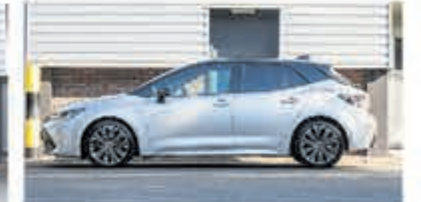
Toyota Corolla 2.0 Hybrid Dynamic € 26.700,-