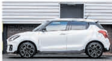
Suzuki Swift 1.4 Sport Sm. Hyb. € 22.700,-