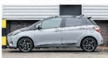
Toyota Yaris 1.5 Hyb Bi-Tone Plus € 17.950,-