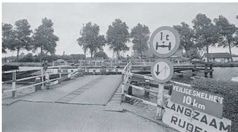
De smalle draaibrug over de Ringvaart bij Bennebroek deed meer dan honderd jaar dienst. Pas in 1974 werd hij vervangen door een bredere moderne brug.

In dit nummer verder aandacht voor het door Stadsherstel aangepakte pand Wilhelminalaan 12 in Heemstede en de ontwikkeling van Bennebroek van tuindersdorp tot forensendorp. Volg de HVHB ook via de gratis nieuwsbrief en de Facebookpagina Historische Vereniging Heemstede-Bennebroek.