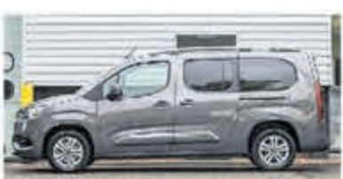
Toyota PROACE Verso CITY 7 pers. 1.2 T Act. Long 7p € 36.134,- excl. btw