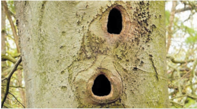
Kinderexcursie op Koningshof.

plaats Koningshof, Duinlustweg 26, Overveen.