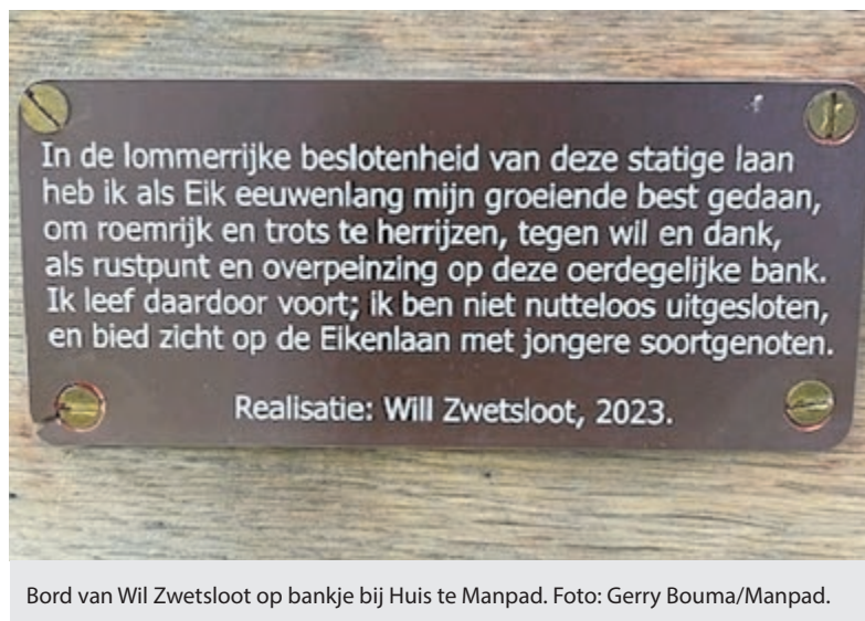
Bord van Wil Zwetsloot op bankje bij Huis te Manpad.

De herintroductie van konijnen is mogelijk gemaakt dankzij subsidies van de provincies Noord-Holland en Zuid-Holland. Het project is onderdeel van een overkoepelend begraasingsplan waarbij Waternet onderzoekt hoe verschillende soorten grazers het best kunnen worden ingezet voor herstel van de biodiversiteit. Het succes van het project wordt bepaald door de waarneming van jonge konijnen volgend voorjaar in de Amsterdamse Waterleidingduinen. Waternet en Stichting Het Zuid-Hollands Landschap zijn vastbesloten om met deze inspanningen bij te dragen aan het herstel van waardevolle natuurlijke ecosystemen in beide gebieden.