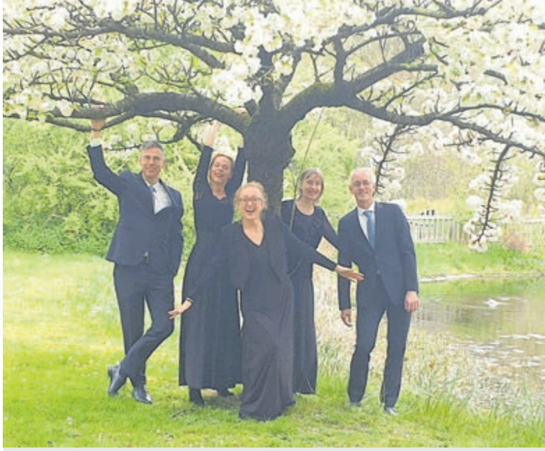
Ensemble Commovente.