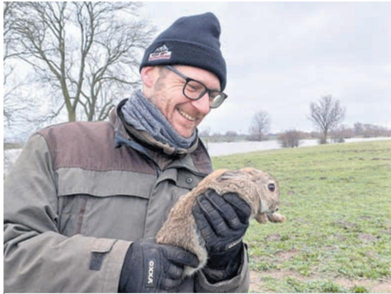
Verhuizing van de konijnen.

Om de gevangen konijnen in alle rust te laten wennen aan hun nieuwe leefgebied, zijn ze op verschillende locaties in zogeheten warandes