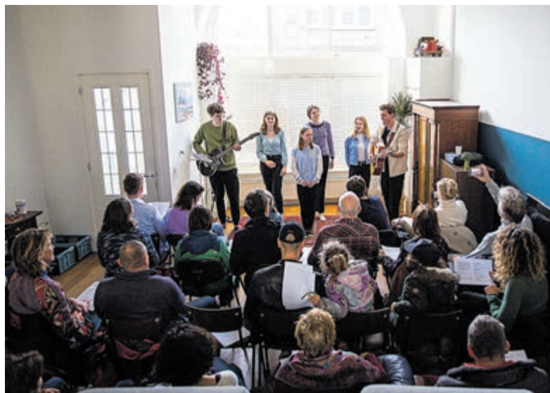
Gluren bij de Buren.

Alle optredens duren 30 minuten en vinden plaats tussen 12 en 17 uur. De optredens zijn bij te wonen zonder reservering en op basis van vrijwillige bijdrage.