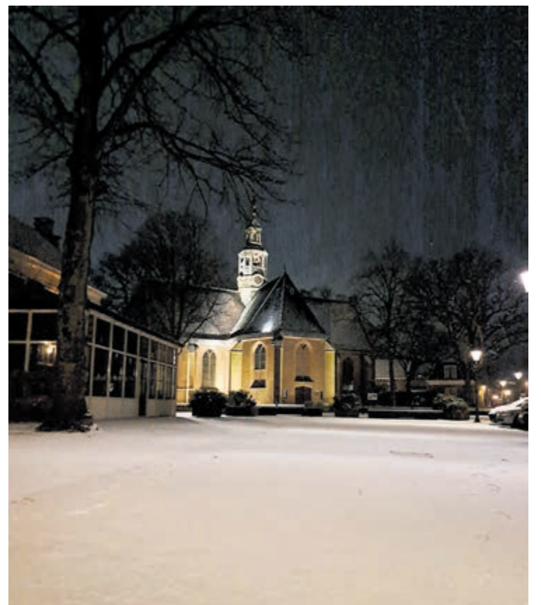
De Oude Kerk in de witte jas, met het besneeuwde plein, dat nog niet belopen is. Dit prachtige plaatje werd in alle vroegte gemaakt door Diandra Soebhag.