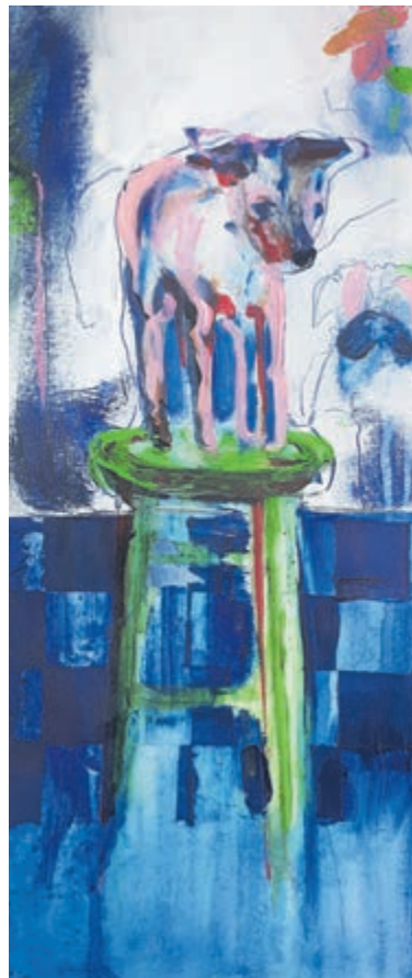
Werk van Marja ten Hoorn.