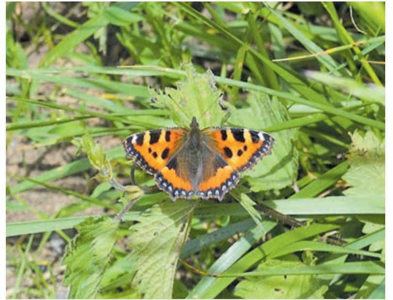
De kleine vos op het land.

4 op de 5 deelnemende boeren hebben inmiddels extra stappen ondernomen om hun bedrijf beter in te richten voor vlinders en bijna 90% wil nog meer maatregelen nemen. "Boeren zetten zich in voor biodiversiteit. Dat zien we nu met dit project