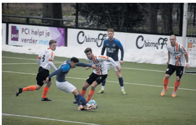
HBC tegen Purmersteijn.

In de tweede minuut van de extra speeltijd schoot de ingevallen Lorenzo de la Rosa van afstand de gelijkmaker binnen. Dat viel verkeerd bij de Purmersteijn-aanhang die de scheidsrechter bij het verlaten van het veld op een applaus trakteerde, wat verwensingen uitte en tegen hem opbotste. Hierdoor voelde de leidsman zich bedreigd. Binnen vijf minuten was de rust weergekeerd. HBC blijft met dit ene puntje nog altijd op de tweede plaats staan met één punt minder dan koploper Ajax en twee punten voor op de nummer drie VV Huizen. Zaterdag 27 januari gaat HBC op bezoek bij SV ARC in Alphen aan den Rijn.