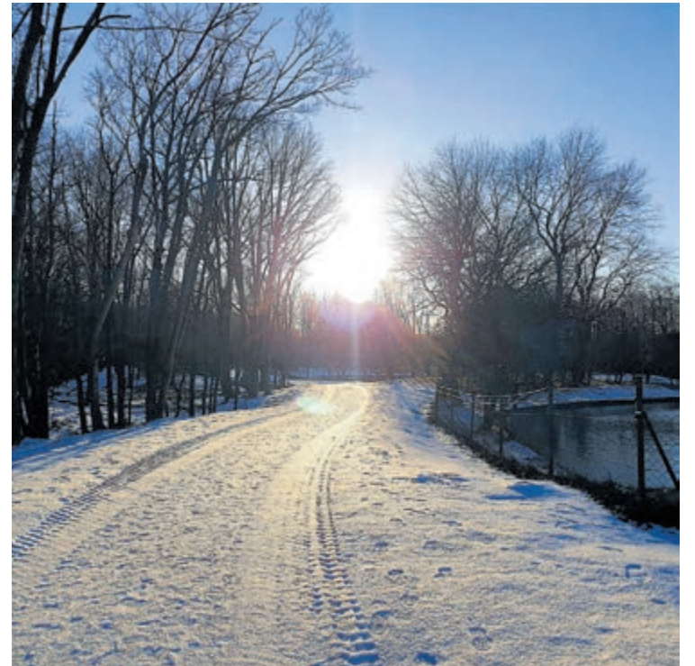
Correspondente Mirjam Goossens maakte dit zonnige en schitterende winterkiesje bij het Panneland in Vogelenzang.