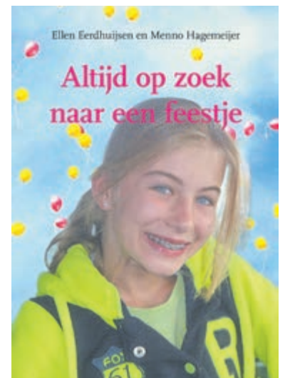
Boekcover 'Altijd Op zoek naar een feestje'. Beeld aangeleverd.

onvermijdelijke lot, maar ook over hoe een 12-jarig meisje sterk en optimistisch blijft en altijd op zoek gaat naar een feestje. Het gaat ook over vriendschap, de liefde tussen broer en zus en de periode na het verlies van je kind. Het geeft eveneens een beeld over hoe je als moeder verder gaat na de dood van je kind en waartegen je allemaal aanloopt. Bij aankoop van het boek ondersteunt de lezer het Prinses Mxima Centrum in hun onderzoek naar behandelmethoden bij hersenstamkanker. Hiervoor is tevens de volgende actiepagina aangemaakt: www.maximaalinactie.nl/fundraisers/ellen-en-menno-altijd-op-zoek-naar-een-feestje . ISBN: 978-94-6365-612-2. Prijs: €19,50