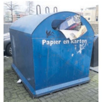
Afvalinzameling, bijv. papier en karton.

Kijk voor meer informatie op www.heemstede.nl/burgerberaad .