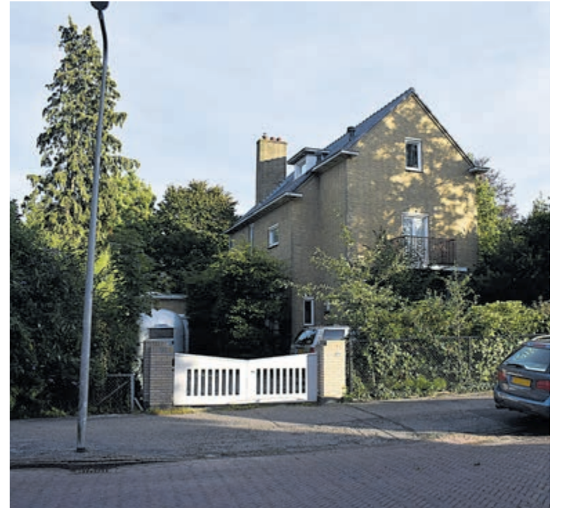
De ambtswoning aan de Molenlaan.

Een meerderheid van de partijen opteren voor het behoud van het huidige pand. Het zal nl. niet