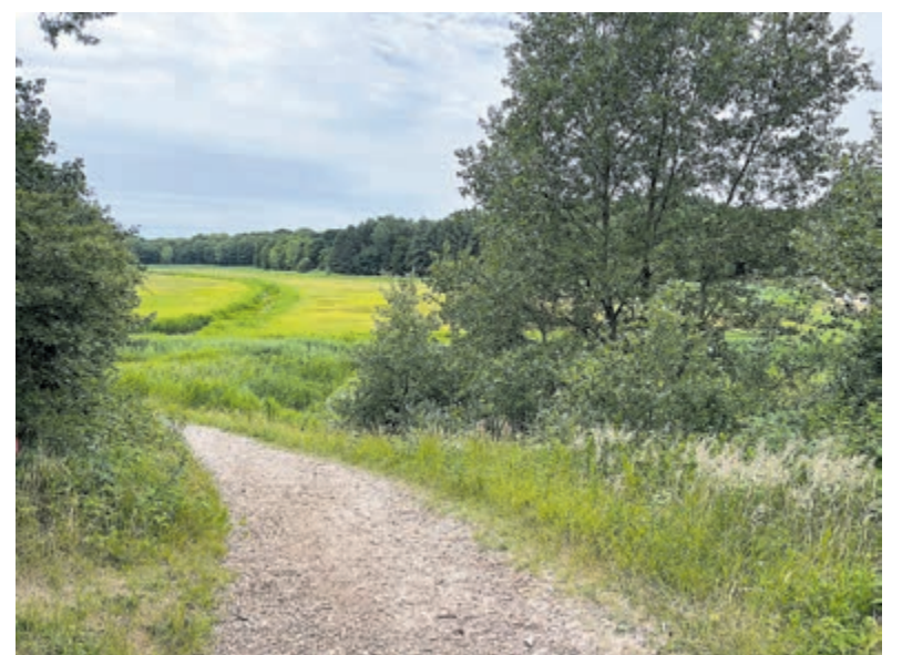
Op de werkplek de omgeving van dichtbij leren kennen.

De werkplek van Marijn is de onlangs geopende vestiging van de Bibliotheek Zuid-Kennemerland, waar bezoekers ook terecht kunnen voor het ophalen van boeken, het lezen van kranten en tijdschriften of het bezoeken van een activiteit. Voor meer informatie en de openingstijden: www.bibliotheek-zuidkennemerland.nl .