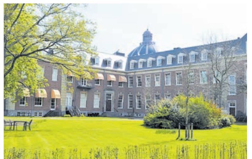
College Hageveld.

seizoen, pittoresk vaak, maar toch ook voor velen heel eenzaam. En daarom werken ze graag samen om het publiek tot rust te brengen in dit winterseizoen. De kerk is om 19.30 uur open. Toegang vrij, een bijdrage wordt erg op prijs gesteld.