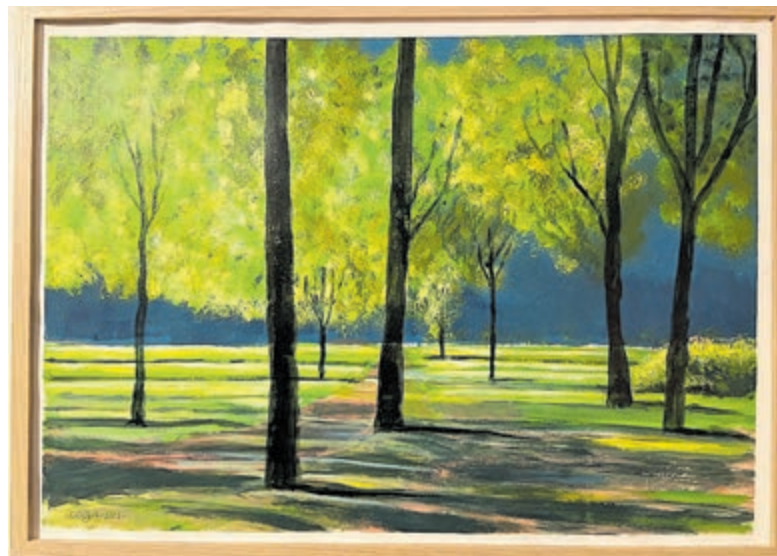
Een van de schilderijen van Guus Coene.

- dinsdag van 09-12 uur - woensdag van 09-17.30 uur - donderdag en vrijdag van 09-12 uur en van 13.30-17.30 uur.