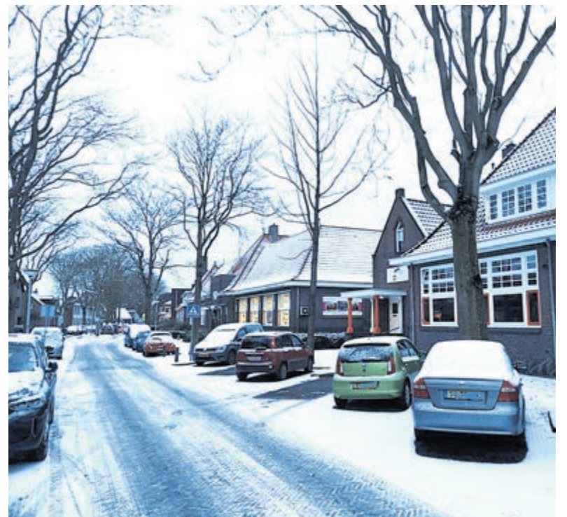
Mooi winterplaatje.

daal hun eerste witte voetjes halen. Januari is nu echt januari. Het is weer een fraai gezicht zo'n wit winterlandschap. Past u wel op voor gladheid als u erop uit gaat.