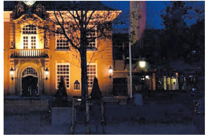
Raadhuis Heemstede.

De conclusie van bureau Goudappel is: het besluitvormingsproces zelf is in grote mate onduidelijk en ongestructureerd verlopen. Dit betreft de vorm, het tijdsplan en de vraag bij wie het initiatief voor de discussie lag. Ondanks het voornemen van het college met een plan te komen is dat er nooit van gekomen. De raad nam het initiatief over, maar discussie is er door de drukke agenda, corona en de naderende verkiezingen nooit van gekomen. Het college is gewoon doorgeslagen met planning voor het WCP, Energietransitie en duurzaamheid gemeentelijk vastgoed.