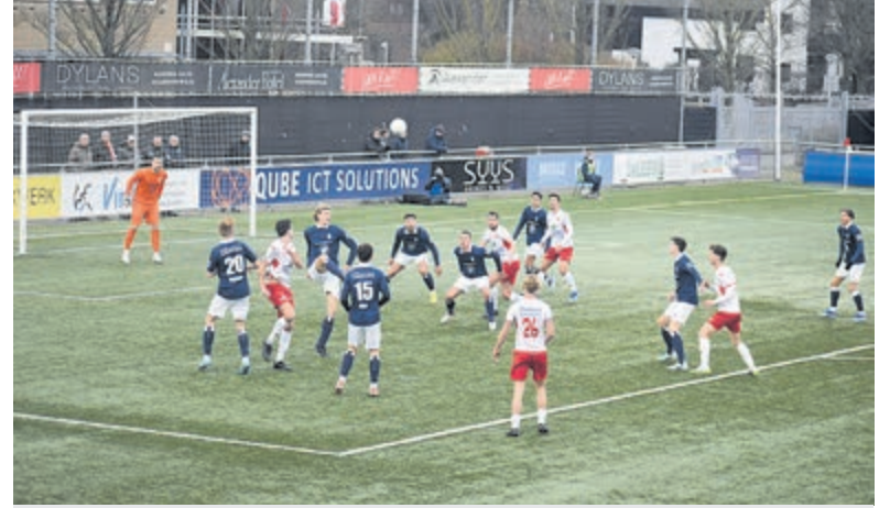
Spannende momenten bij Kon. HFC - VV Noordwijk.

De tweede helft zag er heel anders uit. Noordwijk zette HFC vanaf de aftrap onder druk. De aanvallen volgden elkaar in hoog tempo op zonder dat er veel uitgespeelde kansen kwamen. De HFC-verdediging stond goed en speelde geconcentreerd en ook doelman Michaelis was bij de les om schoten en gevaarlijk situaties onschadelijk te maken. Noordwijk probeerde het ook van afstand met schoten Michaelis te passeren, maar ook dat lukte hen niet. Na een halfuurtje van Noordwijk-aanvallen, kwam HFC weer meer aan aanvallen toe. De ingebrachte wissels gaven nieuwe impulsen aan