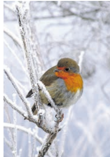
Knutselen om dieren de winter door te laten komen.

Jong en oud kan ook bij de WNF-kraam terecht voor een keur van WNF-artikelen, waaronder de bekende knuffels en allerlei leuke spulletjes.