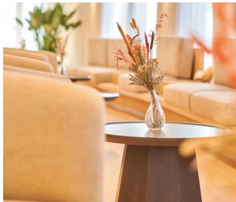
Tijdens de rondleiding op 4 februari krijgt iedereen een kijkje achter de schermen en kunnen alle ruimtes, waaronder de nieuwe Lindezaal, rustig worden bekeken.