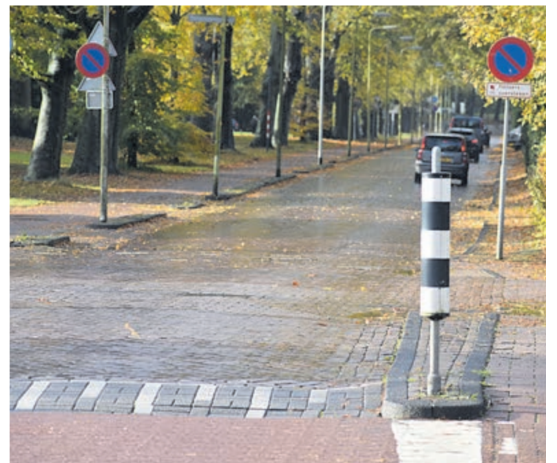
Huidige situatie Van Merlenlaan.

Op https://petities.nl/petitions/behoud-het-vrij-liggende-fietspad-in-de-van-merlenlaan-heemstede?locale=nl en Petities.nl /Valkenburgerlaan leest u meer.