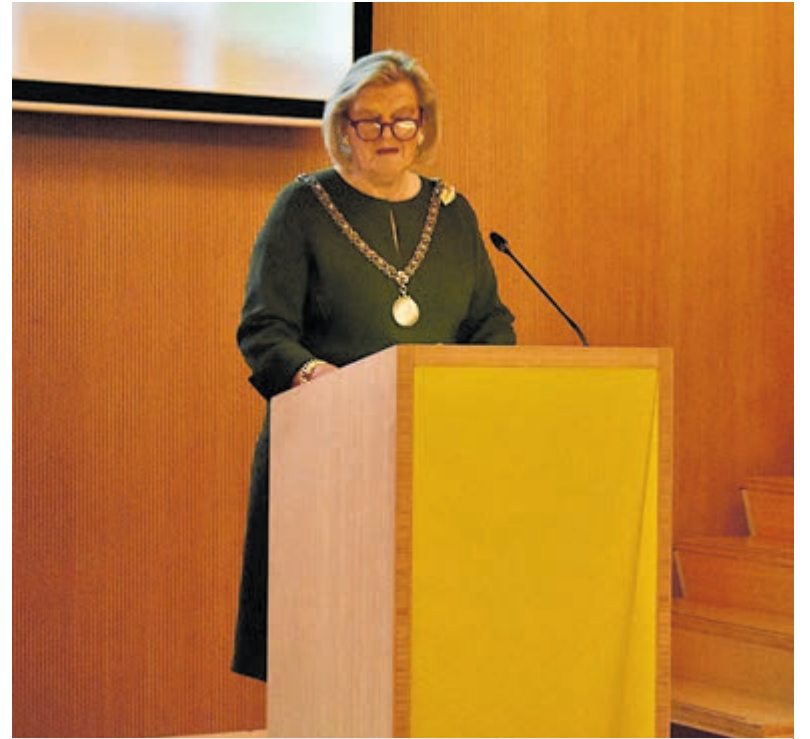
Nieuwjaarstoespraak waarnemend burgemeester Broekers-Knol.

"Als wij samen de schouders eronder zetten, elkaar bijstaan en elkaar vertrouwen kunnen wij in goede samenspraak veel bereiken in onze mooie gemeente", aldus Ankie Broekers-Knol.