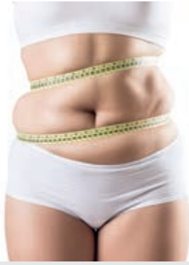
Afvallen? LaRiva helpt.

Heemstede - Sinds 2004 is aan de Raadhuisstraat 27 in Heemstede LaRiva gevestigd. Door middel van voedingsadvies, sporten in warmtecabines, Bodytec en de Ozonzuurstoftherapie, worden mensen begeleid naar een gezond gewicht en daarmee ook naar een gezonder lichaam.