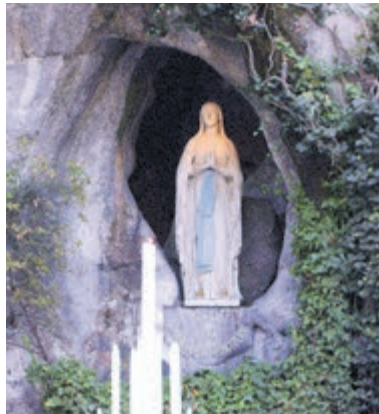
Heilige Maria. Foto aangeleverd.

aldus de dames. Nu gaan ze samen na lange tijd genieten van een vakantie. Eén van de redenen om niet te gaan was toch wel het koor op de maandagmorgen, maar die ochtend is nu vrij.