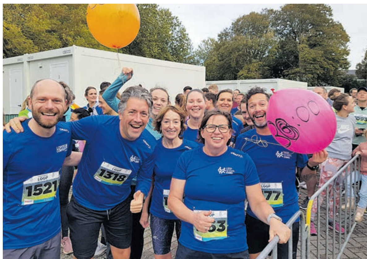
Start 2024 sportief met hardlopen.