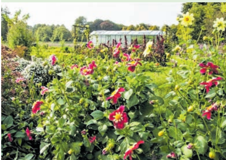
Tuin van Kom In Mijn Tuin.

Graag aanmelden via info@kominmijntuin.com .