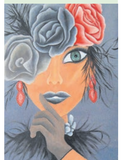
Werk 'Elanor'. Foto aangeleverd.