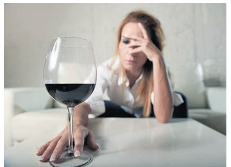
Dry January: een maand zonder alcohol.

Vorige week meldde de landelijke media dat president Macron van Frankrijk tijdens Dry January een wijntje bij het eten had genomen, "omdat hij het zo triest vond, een diner zonder wijn". Op Facebook In Nederland kreeg hij vele lachers op