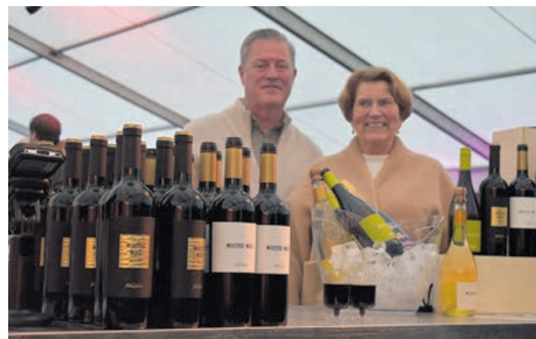
De wijnbar van Gall&Gall.

duizend toeschouwers. Een dag die zonder enige wanklank verliep. Ook dat mag wel eens gezegd worden in het hedendaagse voetballandschap.