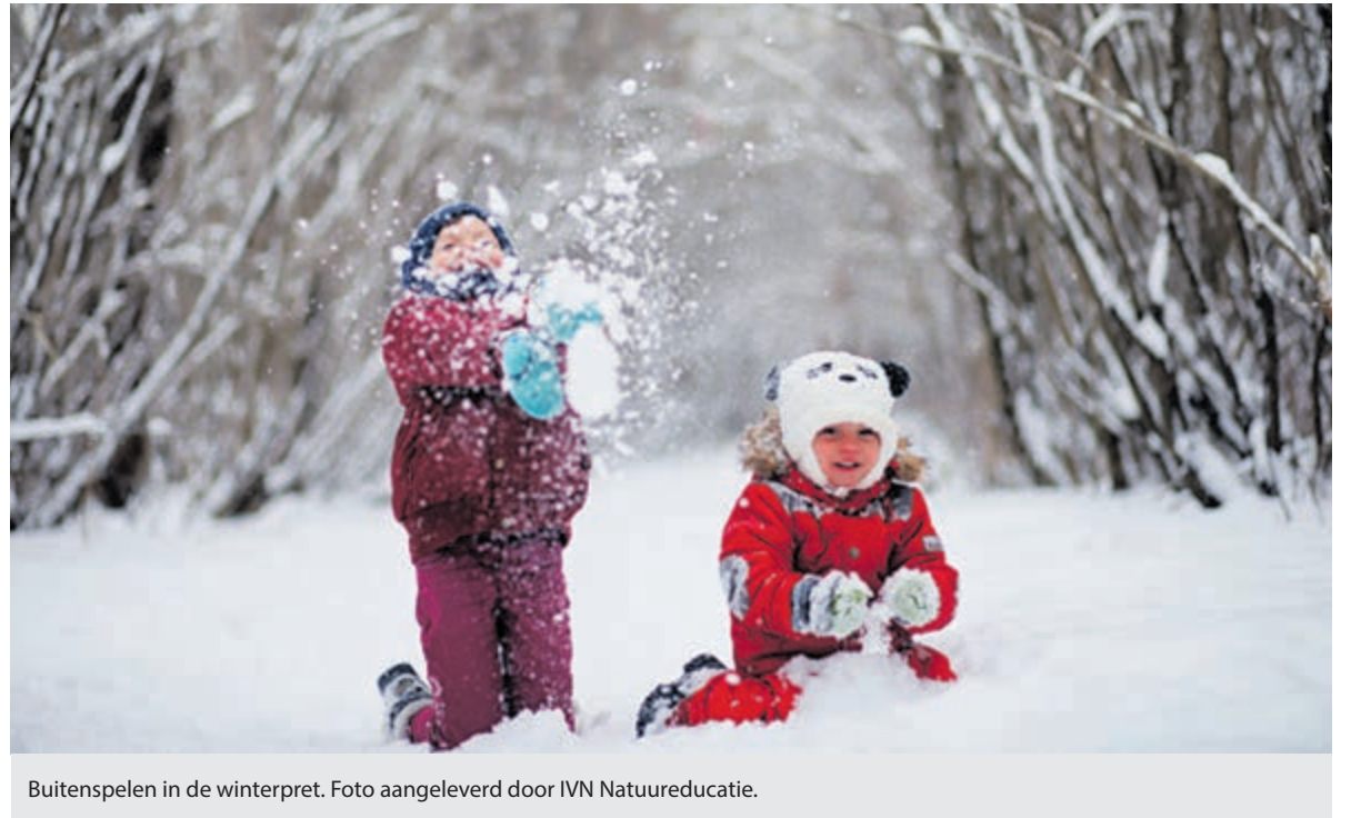
Buitenspelen in de winterpret.

Marc Veekamp, projectleider kinderopvang bij IVN Natuureducatie,