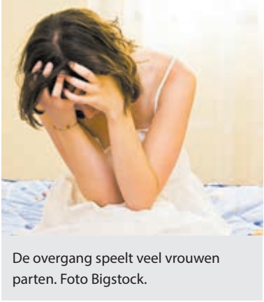
De overgang speelt veel vrouwen parten.

Een financiële bijdrage wordt op prijs gesteld, richtprijs 5 euro.