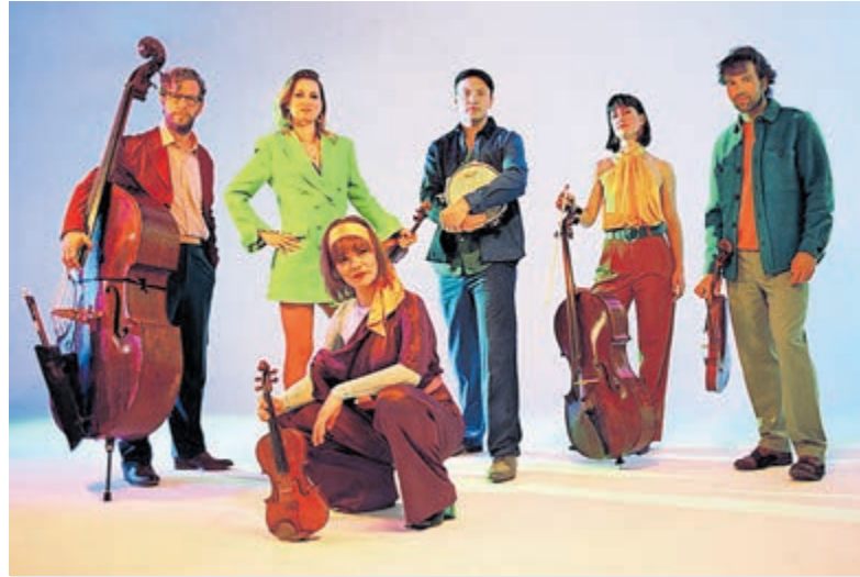
Fuse.