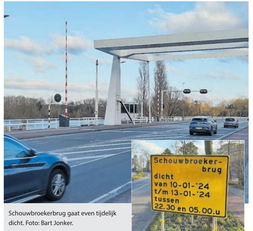
Schouwbroekerbrug gaat even tijdelijk dicht.

Het 'Beweegbare Bruggen'-project waar Antea Group Nederland in samenwerking met Gemeente Haarlem aan werkt, vindt plaats om alle beweegbare bruggen in Haarlem toekomstbestendig en duurzamer te maken.