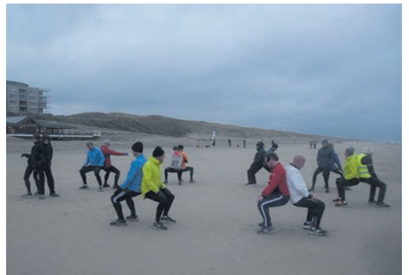
Alle ledematen krijgen aandacht.

En ja, het is vroeg, maar eenmaal meegedaan heb je een hele lange dag voor je. Wilt u meedoen? Kom dan zaterdagochtend tegen acht uur