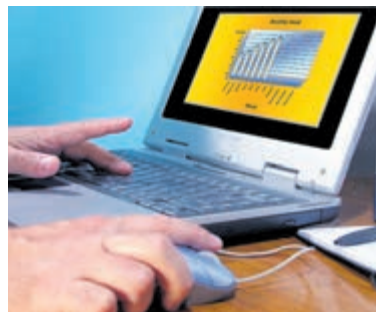
Digitaal vaardig met SeniorWeb.

Heemstede/Bennebroek - De populaire inloopochtenden waren al gratis, maar nu zijn ook in januari de workshops en cursussen gratis. De inloopochtenden zijn bovendien uitgebreid en voortaan tweemaal per maand, met een keer per maand een