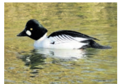
Een wintergast: de brilduiker.

Informatie: Berna van Baarsen, 06-24624622.