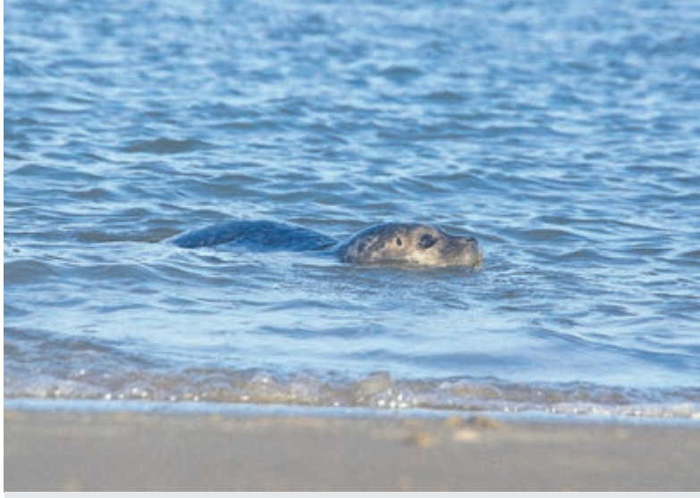
Gewone zeehond.