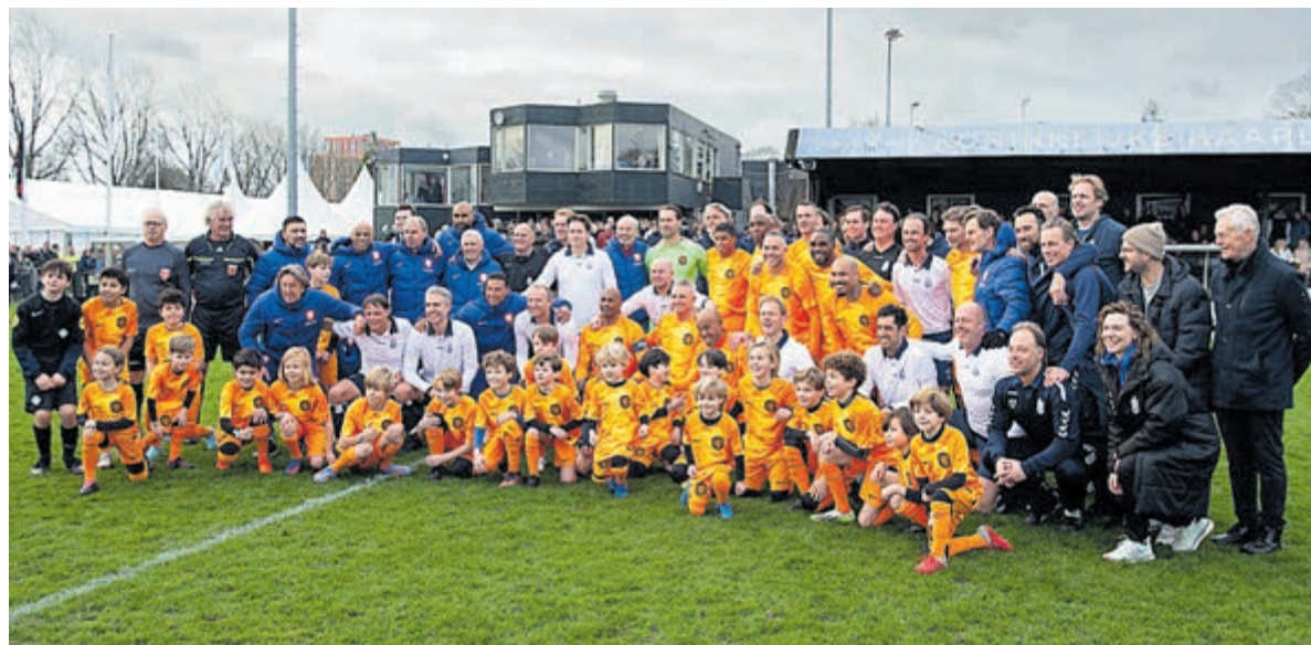
De teams op 6 januari bij Kon. HFC.