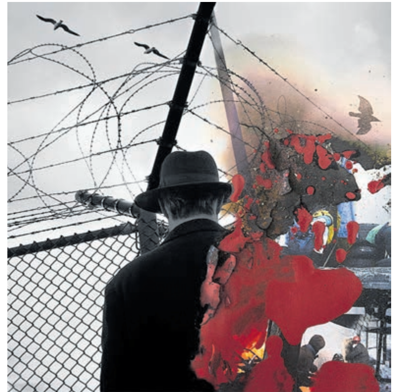
Fotocollage Geek Zwetsloot.

De van oorsprong Finse fotografe Jenna Rutanen studeerde af als Bachelor in de fotokunst aan de universiteit Van Westminster in