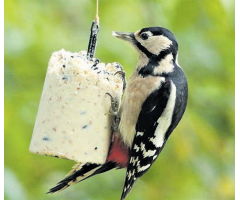
Deze grote bonte specht geniet van een voedzame vetstaaf zonder zout.

Overigens zijn plastic netjes om vetbollen gevaarlijk omdat vogelpootjes erin verstrikt kunnen raken, met breuken of de dood tot gevolg. Beter is om het bolletje in een ijzeren houder of een zogeheten ‘voersilo’ te stoppen.