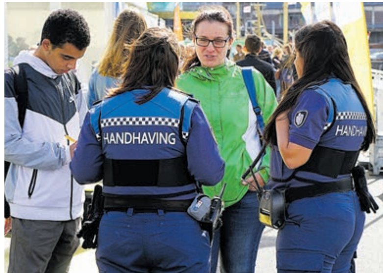
Meer bevoegdheden voor Handhaving.