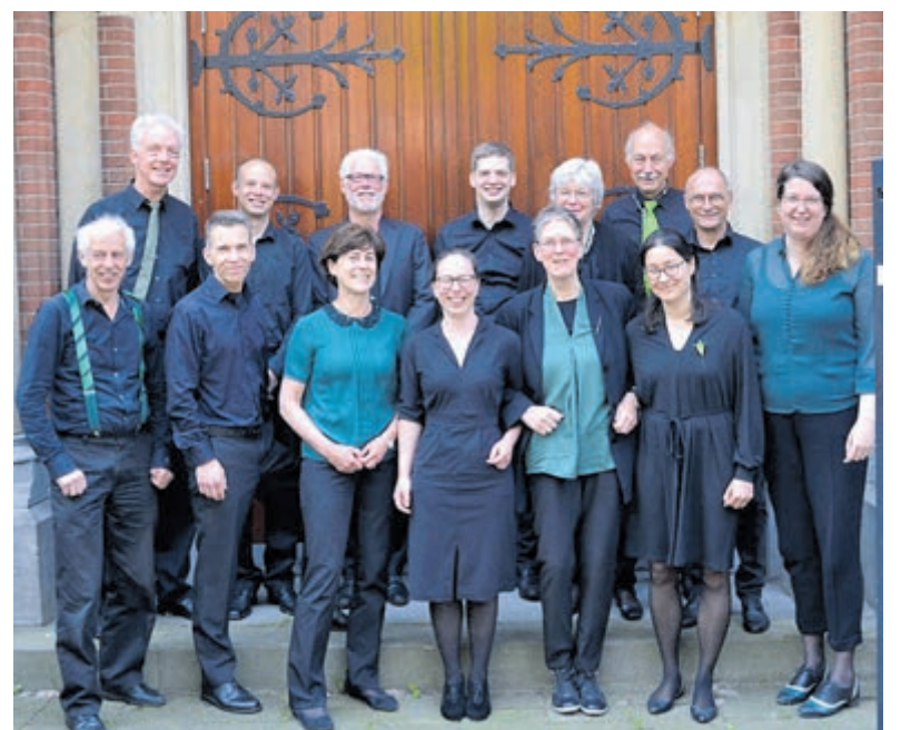
Blazersensemble Windkracht 10. Foto aangeleverd.

Van Brahms variaties op een thema van Haydn op. 56. Van Ravel 'de Pavane': 'Pour une enfante défunte' van Poulenc: Musique faire plaisir. Een divertissement van Emile Bernard, en tot slot de Suite Siciliana van Cesarini. Gezien de beschikbare tijd worden er delen uit de genoemde werken gespeeld. Een programma met een beschrijving van de uit te voeren werken wordt bij de ingang uitgereikt. Bij de uitgang is een collecte en is uw bijdrage zeer welkom, waarvan de onkosten worden voldaan en wat ervan overblijft bestemd is voor het restauratiefonds van de Oude Kerk. Na afloop is er koffie, thee en gebak verkrijgbaar in de Pauwehof.