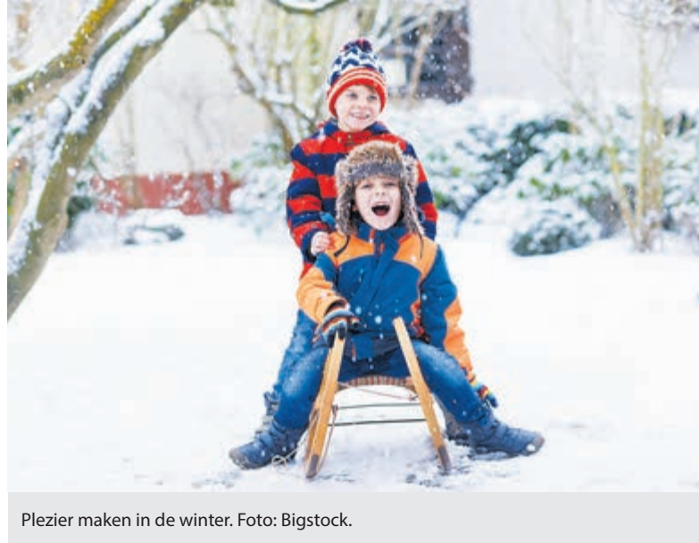
Plezier maken in de winter.

'In de winter is naar buiten gaan een extra uitdaging. Het is koud en nat, wat de drempel verhoogt. Maar het is natuurlijk wel heel gezond,' licht