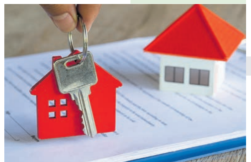
Vierkante meters nu de sleutel voor uw WOZ-waarde.

De gemeente Bloemendaal heeft ook een filmpje met uitleg op haar website geplaatst, te vinden op: www.bloemendaal.nl/actueel/hoe-berekenen-wij-uw-woz-waarde .