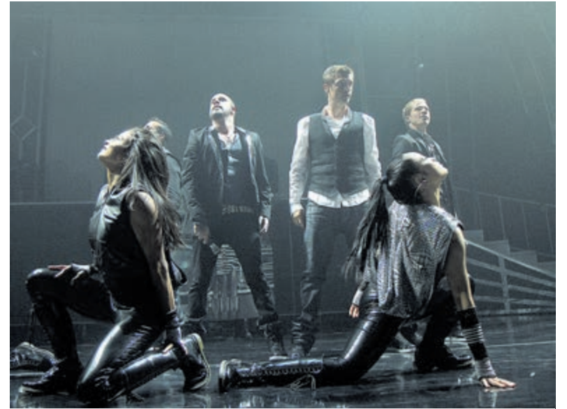
Ben jij het nieuwe jonge talent op het podium net als destijds de Back Street Boys?

Kijk voor meer informatie over autobranden tijdens Oud & Nieuw 2021/2022 en het onderzoek op: www.unive.nl/autoverzekering/ autobranden-rond-jaarwisseling.