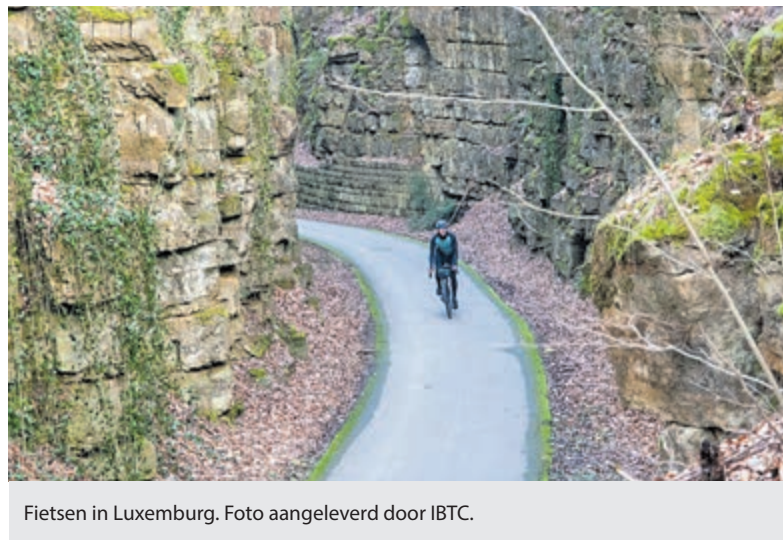
Fietsen in Luxemburg.

Het fietstoerisme als wapen tegen ontvolking. Het lijkt misschien ver gezocht, maar in de Spaanse regio Aragón is dit een onderdeel van het