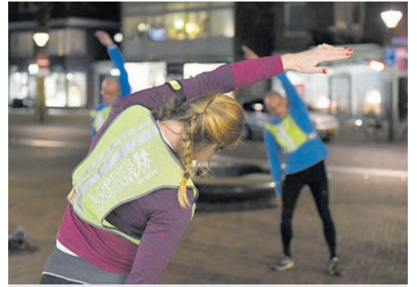
Buiten sporten en oefeningen doen.

Alle informatie hierover staat op www.loperscompanyheemstede.nl . Bellen kan ook naar 0620 41 00 66 of loop binnen bij Lopers Company by Enno op de Binnenweg 35 in Heemstede. Daar kun je gelijk alle antwoorden op je vragen krijgen.