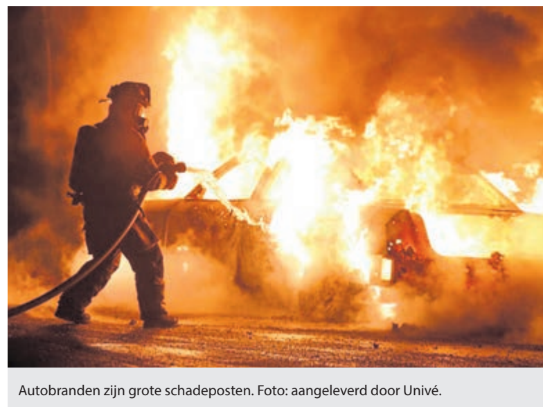
Autobranden zijn grote schadeposten.

In de nacht van 31 december 2021 op 1 januari 2022 werden maar liefst 289 meldingen gedaan van een autobrand, 45 minder dan vorig jaar. Vanwege de grootste autodichtheid is het volgens Univé niet verrassend dat de meeste autobranden vanuit het westen van het land werden gemeld. Zuid-Holland vindt zichzelf ondanks een daling van het aantal meldingen van 28,5% ook dit jaar weer terug als koploper in het overzicht. Met het totaal van 88 noteerde