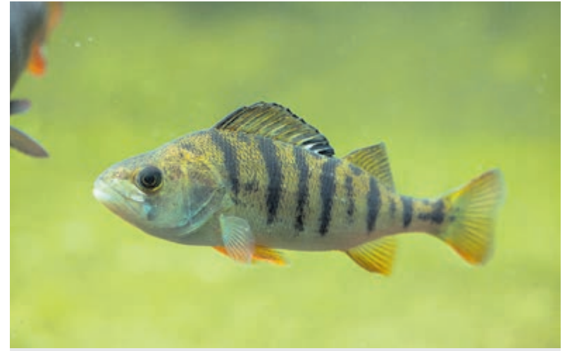
De baars ( Perca fluviatilis ).

kleine vissen. Ja, zelfs de jongen van de baars zelf zijn niet veilig voor hun vrazucht: een echte kannibaal. De baars leeft doorgaans als jonge vis in scholen, oudere baarzen leven solitair. Al is de baars dus een ware roofvis, wil dit niet zeggen dat ze zelf, ondanks hun stekels, niet ten prooi vallen, vooral aan snoeken en snoekbaarzen. Aan de waterkant worden jonge baarzen ook graag verschalkt door bijvoorbeeld reigers en aalscholvers. De baars kan 50 tot soms wel 60 cm lang worden en 16 jaar oud worden. Een volwassen baars kan wel tot 4,5 kilo wegen. De paaitijd van de baars vindt van april tot mei plaats. Het wijfje zet haar eieren in lange netvormige banden af op waterplanten, (riet) stengels en in het water liggende boomtakken.