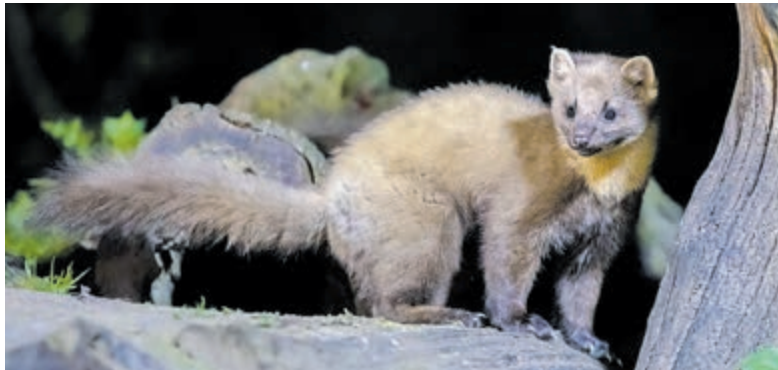
De boomarter of edelarter (Martes martes) is een echte nachtbraker.

De beelden worden alleen gebruikt voor dit onderzoek. Op de website: www.zoogdierveniging.nl/zoogdiersoorten?filterterm=205 vindt u meer informatie over marterachtigen en andere zoogdieren.