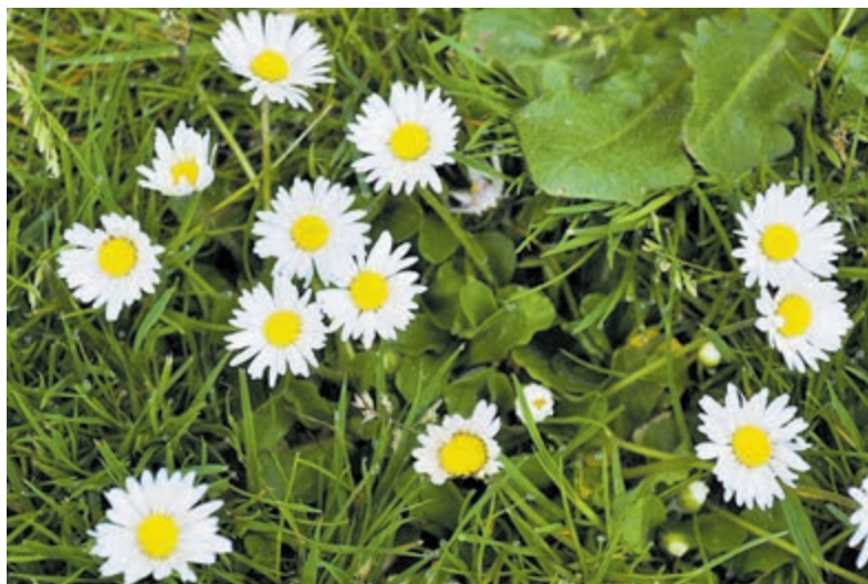
In 2021 waren bloemennamen en vogelnamen (denk bijvoorbeeld aan Madelief of Merel) minder populair.

In 2021 gingen 165.416 mannen met de naam Johannes met pensioen. Bij de vrouwen waren dat 210.312 Maria's. Bij de mannen neemt Jan de tweede plaats in (101.696 keer) en staat Cornelis op de derde plaats (76.479 keer). Bij de vrouwen is Johanna de nummer twee (166.819 keer) en staat Anna op de derde plaats (79.666 keer).