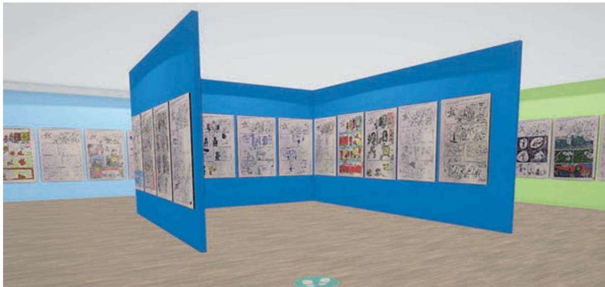
De expositie van ingezonden striptekeningen.