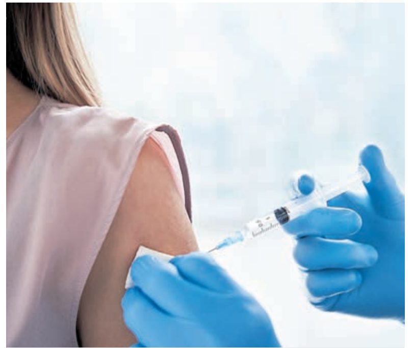
De boosterprik.