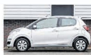
Citroën C1 1.0 VTi Shine € 12.750,-