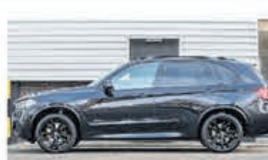
BMW X5 xDrive40e iP.High. Ex € 56.950,-