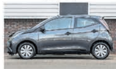
Toyota Aygo 1.0 VVT-i x-now € 7.250,-

Turenhout de occasiondealer van Heemstede en al meer dan 40 jaar uw vertrouwde onderhoudsadres.