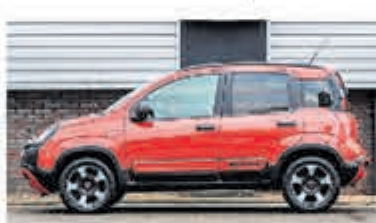
Fiat Panda 1.2 City Cross € 11.950,-