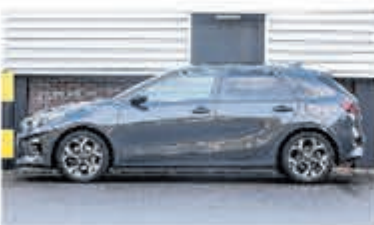
Kia Ceed 1.4 T-GDi GT-PlusL. € 21.700,-