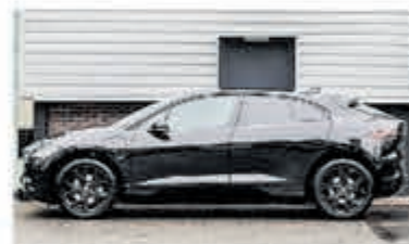
Jaguar I-PACE EV400 SE € 49.950,-