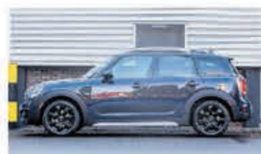
Mini Countryman 1.5 Cooper Salt € 26.950,-