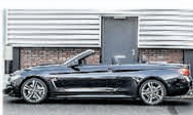
BMW 4 Serie 430i Cabrio € 49.950,-