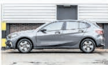
BMW 1-serie 116d Sp.Line Edition € 34.950,-