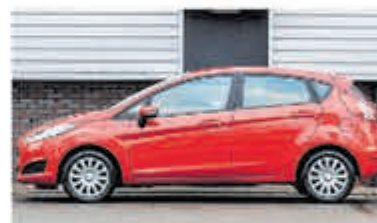
Ford Fiesta 1.0 EcoB. Vignale € 11.900,-