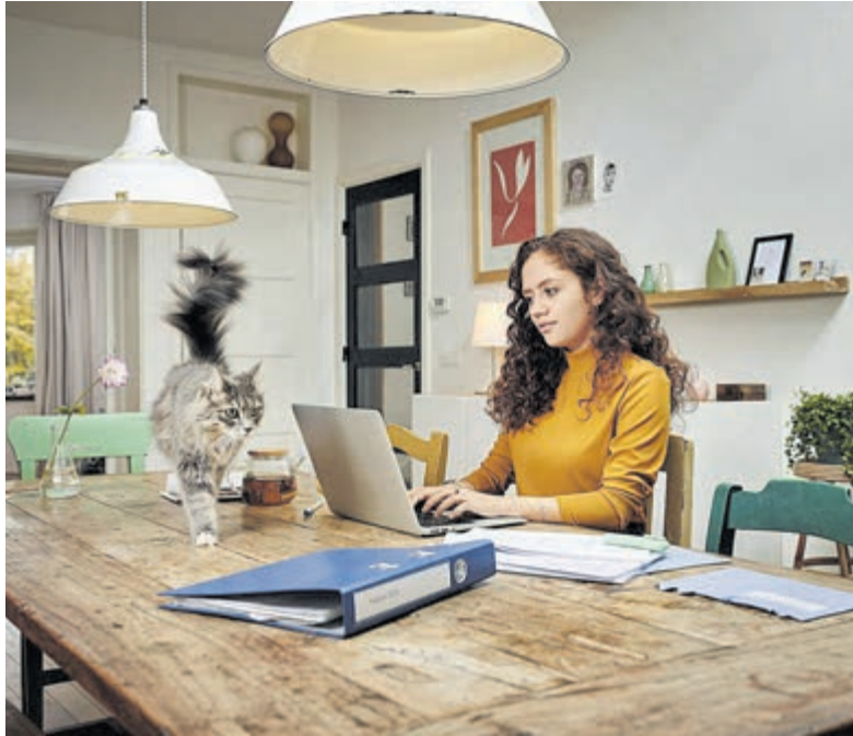
Online aangifte doen.

Heemstede/Bloemendaal – In december en januari verstuurt de Belastingdienst ongeveer 4 miljoen voorlopige aanslagen inkomstenbelasting over 2022. Ook in Noord-Holland ontvangen veel mensen een voorlopige aanslag. Veel Nederlanders kijken direct of binnen enkele dagen of de gegevens en bedragen op hun voorlopige aanslag kloppen. En ook gedurende het jaar staan 7 op de 10 mensen stil bij de gevolgen van veranderingen op de voorlopige aanslag. Dat blijkt uit een flitspeiling in opdracht van de Belastingdienst.