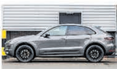
Porsche Macan 3.0 S € 45.950,-