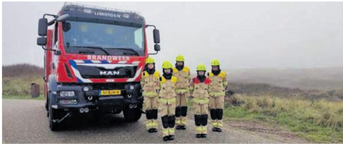
Een brandweerteam.

spoorlijn (de Traliebrug) aan de Leidsevaart in Vogelenzang en de Margrietenlaan in Hillegom.