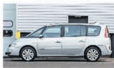
Renault Grand Espace 2.0 T Initiale € 6.950,-