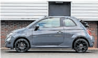
Fiat 500 C 0.9 TwinAir € 15.900,-