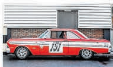
Ford Usa Falcon FUTURA SPRINT € 79.000,-