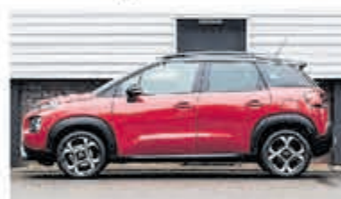
Citroën C3 Aircross 1.2 PT S&S Shine € 24.950,-