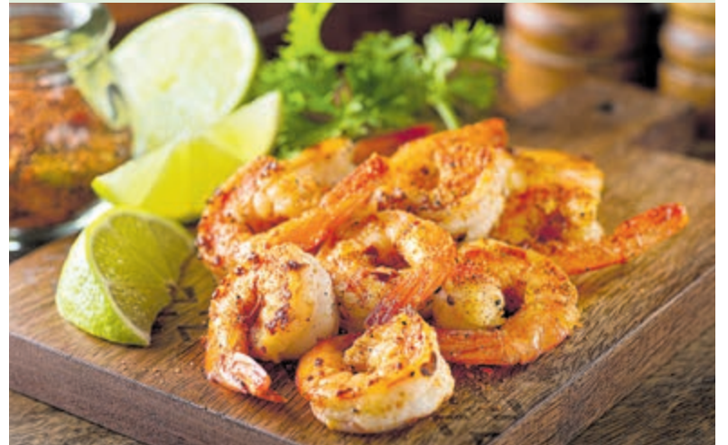
Ook gamba's zijn heerlijk om te grillen met cajunkruiden.

Doe alle ingrediënten in de keukenmachine/blender en maal de kruiden fijn. U kunt uw gerechten insmeren met deze kruidenmix. Weet wel: hoe langer de cajunkruiden intrekken, hoe pittiger. Succes en eet smakelijk!