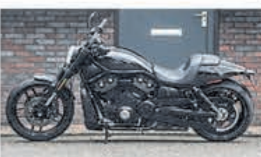
Harley Davidson Chopper VRSCDX Night-Rod Sp. € 21.950,-