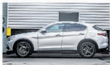
Alfa Romeo Stelvio 2.0 T AWD Super C.E. € 36.900,-