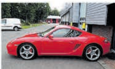
Porsche Cayman S Tiptronic Uniek 71.000 km € 31.950,-