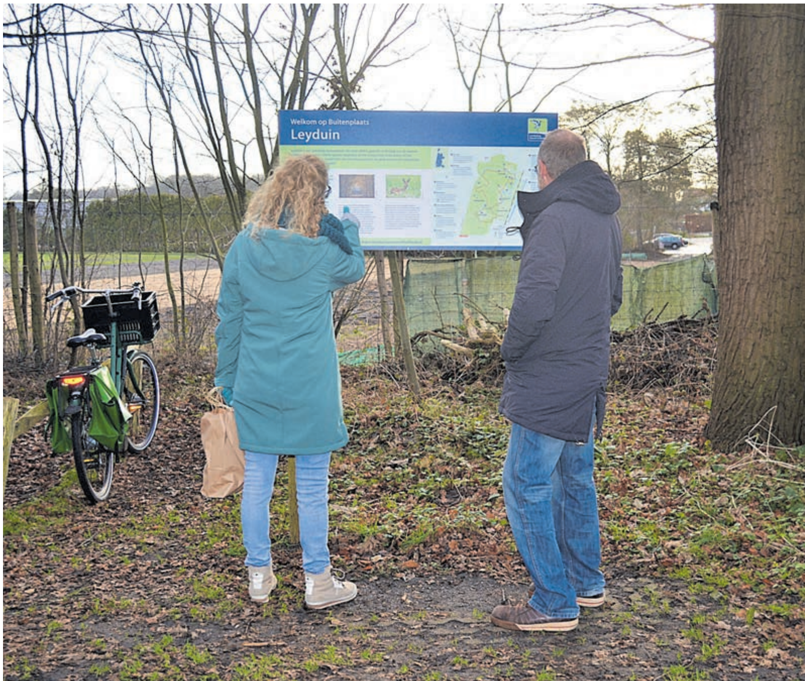
Met het mooie weer een frisse neus halen in Leyduin, Vogelenzang. Foto: Bart Jonker (gemaakt met toestemming van betrokkenen).