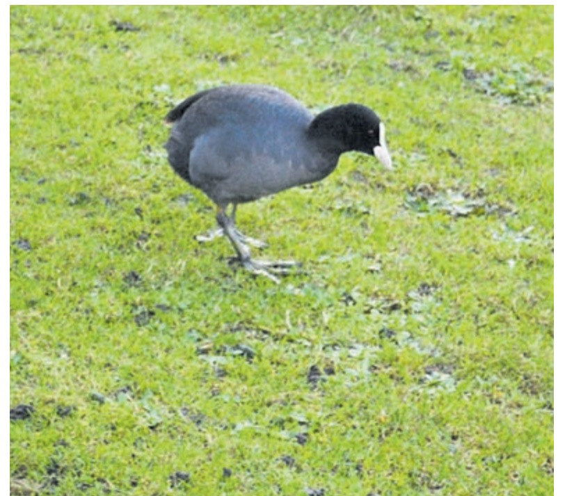
Meerkoet op zoek naar voedsel aan de waterkant.

Het menu van de meerkoet bestaat uit kleine waterdieren, insecten, wormen, slakjes en jonge wortels van waterplanten. De meerkoet is een felle territoriumverdediger in de nabijheid van zijn/haar nest, dat vaak stevig gebouwd wordt tussen het riet. De broedtijd van de meerkoet duurt van maart tot mei en een nest kan zes tot negen eieren bevatten. Als er gevaar dreigt, rennen meerkoeten rennend en trappend over het water, waardoor water opspat en de vijand in verwarring wordt gebracht.