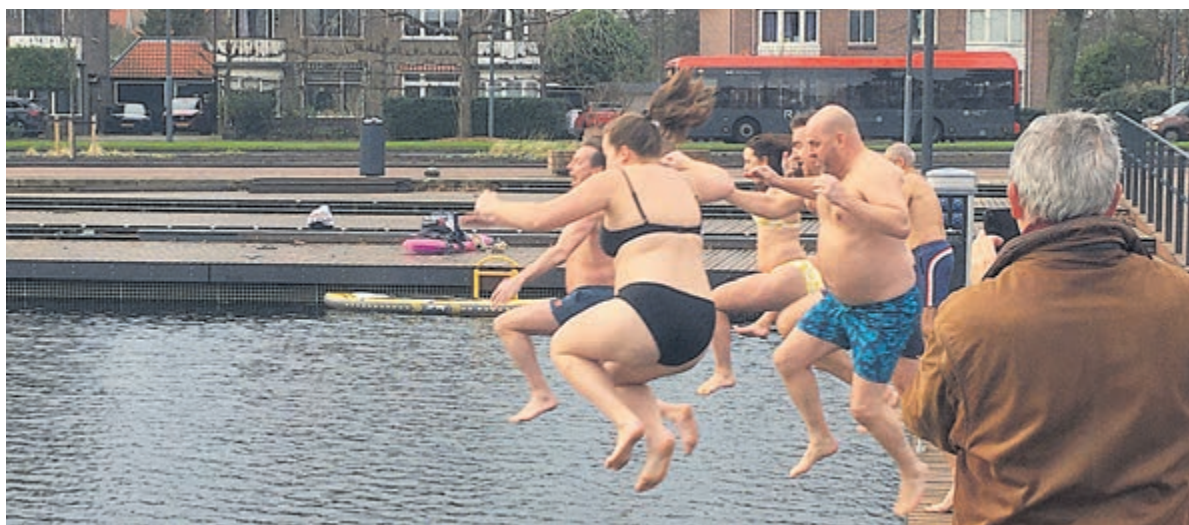
Enkele trotseerden dapper het water van de Heemstedse Haven bij de nieuwjaarsduik.

Het bos hermetisch afsluiten is niet in het belang van de vele recreanten die dagelijks Groenendaal bezoeken.