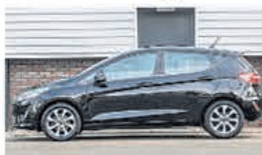
Ford Fiesta 1.0 EcoB. Vignale € 15.900,-