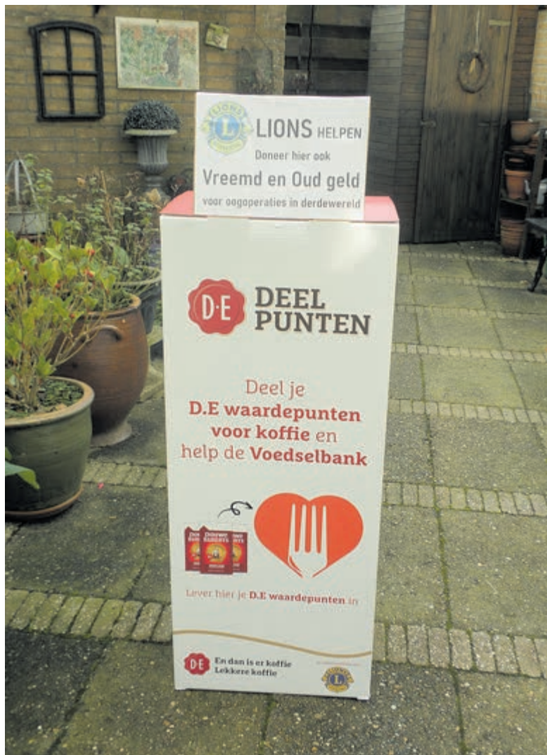
Inzamelbox Lions Club.

Wel een heel andere actie met een ander goed doel. Het blijkt dat veel mensen na hun vakanties nog wat munten en/of bankbiljetten hebben liggen. Dan is het mooie gelegenheid om het te doneren aan het goede doel.