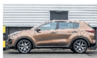
Kia Sportage 1.6 T-GDI 4WD GT-L. € 25.750,-