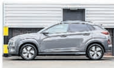
Hyundai Kona EV Fashion Des 39kWh Rijklaarprijs! € 26.900,-