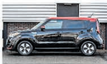
Kia e-Soul ExecutiveLine 30kWh € 21.950,-