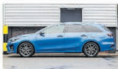
Kia Ceed 1.4 T-GDi GT-Line € 25.950,-