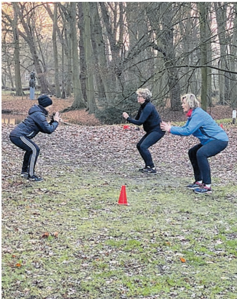
GreenFit in het Groenendaalse Bos.

Geïnteresseerden kunnen kijken op de site van FM HealthClub of mailen naar info@fmhealthclub.nl. Bellen heeft echter niet zoveel zin, aangezien de trainers voornamelijk in het bos te vinden zijn.