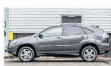
Lexus RX 400h Edition € 11.950,-