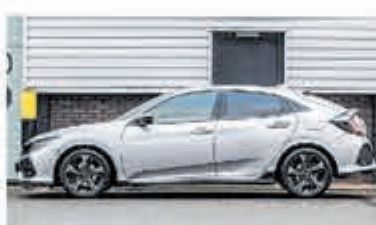
Honda Civic 1.5 i-VTEC Sport + € 24.950,-