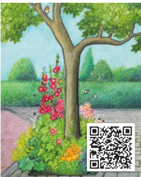
Boomspeigel (illustratie: Vera de Backker)

Beide momenten zijn gratis. Scan de QR-code om u aan te melden voor de middag of avond.