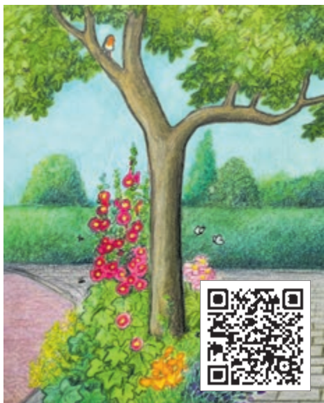
Boomspeigel Vera de Backker

Beide momenten zijn gratis. De eerste 50 aanmeldingen krijgen een verrassing, dus wees er snel bij. Scan de QR-code om u aan te melden voor de middag of avond.