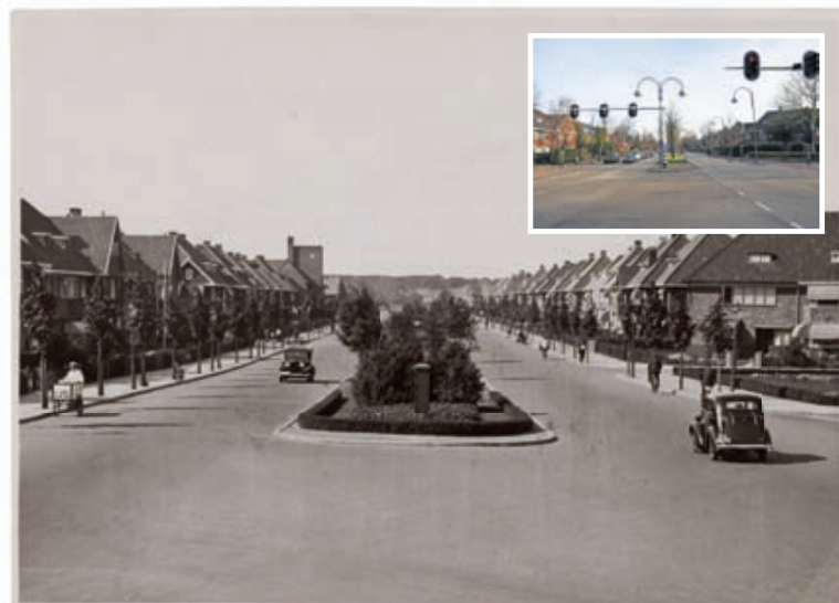
De Heemstedse Dreef in 1935 en 2012

Op de expositie 'Heemstedse wijken te kijk' wordt het verleden, het heden en de toekomst van deze gemeente belicht. Daarbij ligt de nadruk op de architectonische, stedenbouwkundige en landschappelijke verschijningsvorm maar is er vanzelfsprekend ook aandacht voor de (sociale) geschiedenis.