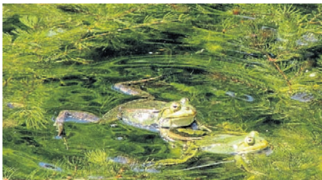
Een paartje groene kikkers.