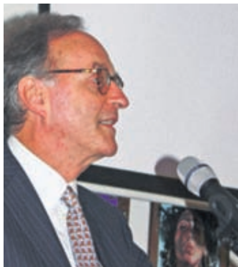
Alexander Rinnooy Kan, voorzitter van de SER, hield een inspirerende toespraak over duurzaamheid.

De uitkomsten van de werkconferentie worden meegenomen in de plannen voor de komende vier jaar. Voor een impressiefilmje en foto's kunt u terecht op www.heemstede.nl .