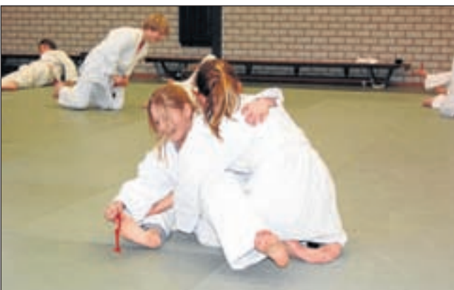
Sportservice Noord-Holland, Judoclinic op het Heemstede Barger.

niets! Tienercafé Blue Moon is elke dinsdag- en donderdagmiddag van 14.30 tot 17.30 uur open. Op donderdag 16 december is er een gezellige Kerstborrel als afsluiting voor de Kerstvakantie. Ook dit kost niets en wordt superleuk. Je komt toch ook? Je hoeft je niet op te geven. Tienercafé Blue Moon is in de jongerenruimte Plexat bij Casca in de Luifel, Herenweg 96, Heemstede.