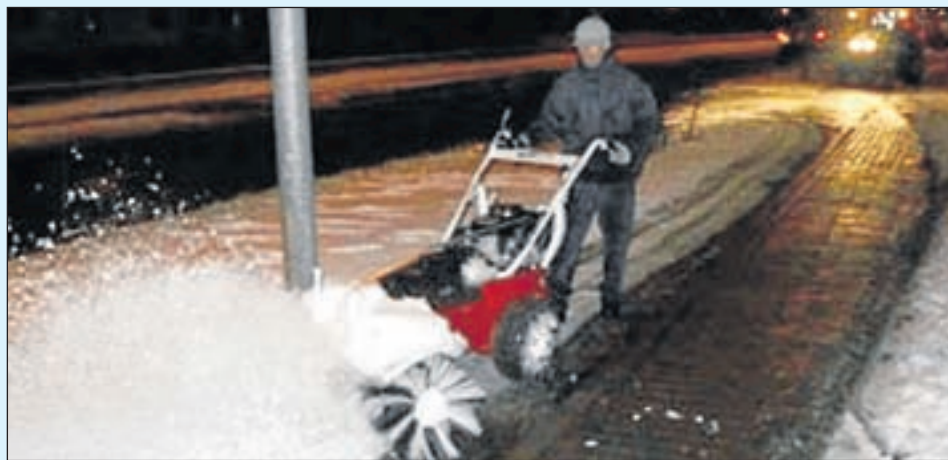
Zaterdagavond – Kleine borstelmaschine in actie op de Leidsevaart Haarlem.

Hier en daar zijn kleine verbeteringen mogelijk van de veegroutes. Graag horen wij of uw fietsroute goed en op tijd is schoongemaakt. Stuur uw reactie naar haarlem@fietsersbond.nl of plaats deze op www.fietsersbond.nl/meldpunt