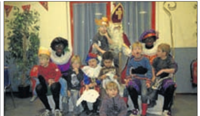
Sinterklaas kon bij VEW natuurlijk niet verstek laten gaan.

Judo Op School is een succesvol schoolsportconcept, ontwikkeld door de Judo Bond Nederland (JBN). De deelnemers maken op school op een speelse manier kennis met alle facetten van de judosport. Judo is als middel goed inzetbaar vanwege de vormende waarde van de sport. Op de mat leren kinderen samenwerken en de regels, normen en waarden van de judosport. Respect staat centraal; een waarde die in de maatschappij van vandaag ook een belangrijke rol speelt. Onderzoek onder-schrijft het positieve effect van de inzet van judo als middel in de ontwikkeling van een kind.