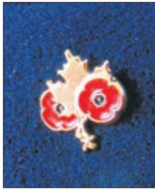
Gouden maple leaf voor de poppy vrienden.

Heemstede - De twaalf vrienden van de veteranen, die rond 11 november de klaprozen uitdeelden, vertelden vrijdagmiddag in de bibliotheek van Westerduin over hun ervaringen bij de Dekamarkt aan de Binnenweg en in de AH-vestiging aan de Blekersvaartweg. Twee supermarkten waar ze hartelijk ontvangen worden door de leiding en de medewerkers. Ze mogen er de klaprozen, poppies, opspelden, het symbool van de gesneuvelden van alle oorlogen in de wereld. Voor het eerst werd de Poppy in 1915 gebruikt in de eerste en laatste regels van een gedicht van een Canadese legerdokter op de slagvelden van Ieper. De vrienden deelden voor het vierde jaar de poppies uit, deze keer ook met een jongen van 18 jaar. Volgend jaar zullen vier jongens en drie meisjes van 17-18 jaar meedoen. Voor iedereen die de poppies uitdeelt is het een wonderlijke ervaring. Hoe verrast mensen kunnen reageren; de meeste positief tot zeer geïnteresseerd, een enkeling wat knorrig doorlopend. Alhoewel het in eerste instantie