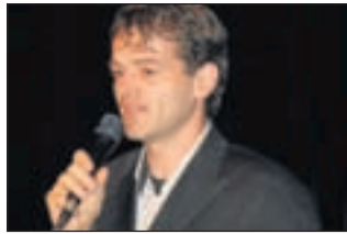
Nieuwe gastheer voor Vrienden van de Luifel.

Een groot koor met 65 leden waarvan vijftien bassen en tenoren hun mannetje staan, naast de sopranen en alten. Dat is het