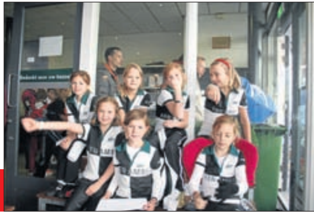
Meisjes 6E03 sport graag sportief!

In de loop van de komende maanden volgen nog meer acties in het kader van de Sport Sportief-campagne zodat het thema het hele seizoen onder de aandacht blijft