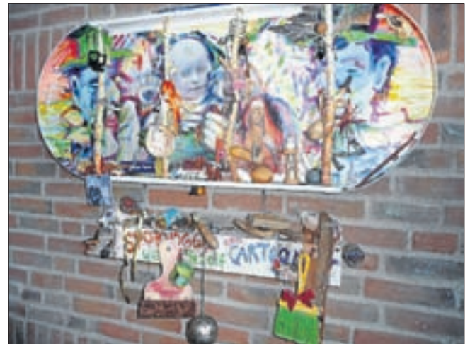
Ook enthousiast bezoek kregen de ateliers in De School, het voormalig Nova-college aan de ir Lelylaan. Kunst van divers pluimage, wat het bezoek ook voor de niet-kenners laagdrempelig maakte.