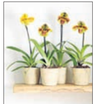
Venusschoentjes (Paphiopedilum) zijn natuurlijke sfeermakers.