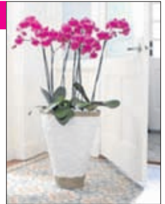
Natuurlijk design in huis: Vlinderorchidee (Phalaenopsis).

Kijk voor meer informatie en bijzondere orchideeën op: www.orchids-info.com