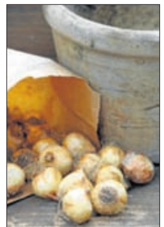
Bloembollen planten voor fleurig voorjaar.

oktober tot en met zondag 17 oktober 2010 vindt de Nationale Bloembollenmarkt op Keukenhof plaats. Kwekers bieden bijzondere bolgewassen aan. Bovendien geven de tuinmannen van Keukenhof plantdemonstraties