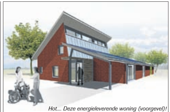
Hot... Deze energieleverende woning (voorgevel)!

Koops Makelaardij Haarlem, Gedempte Oude Gracht 152A, 2011 GX Haarlem Koops Makelaardij Amstelveen Amsterdamseweg 576, 1181 BZ Amstelveen