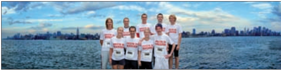
Pasta di Mamma team rent voor de Voedselbank.