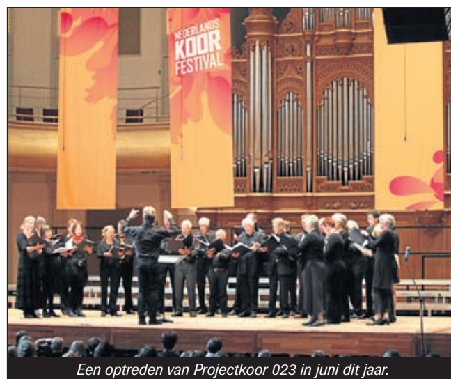
Een optreden van Projectkoor 023 in juni dit jaar.

leid, bedrijfsadviezen en dergelijke was dat vroeger wel wat anders. Toen moest er samen nog 'geknokt' worden voor een paar vrije dagen en sociale voorzieningen voor zelfstandigen, terwijl werknemers al lang hun wettelijke vakantiedagen en sociale voorzieningen hadden 'veroverd'. Een klein voorbeeldje hiervan overgenomen uit de notulen van 1946 van een van de voorlopers van de HAGEFO: 'Onderling Belang'.